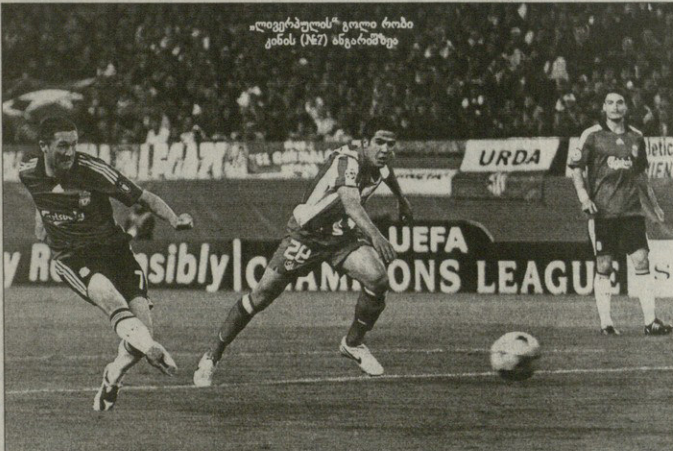
„ლივერპულს“ გოლი რომი კინს (167) მსგავრობაზე

ატლიტიკო V ლივერპული 01 კინ (14), 02 სიხო (83) ატლიტიკო: ფრანკო სტარბიდისი, ან ტონი ლობესი, პურეს, კამპო (რე ვალი გარსია 72), მინდო სიხო, ადვო რო, ლესი გარსია (ფერო 46), ფორ ლანი, სინამაბორელი (მიელი 76) შერთანელი: ხაგივი ავირი ლივერპული: რენა, დონან, აგერი, არ ბელი, კარაგერი, ვერინო (ბადელი ნე, როტი, ხაბი ალითონი (კლუპი 76), მასკრაი, ბრაიუნი, კინი (კრკი 83) შერთანელი: რადელ ბერტსი გაფრთხილება: მინდო, როტი, არბელია შხაგი: კლუპი ჰო ლარსენი (ანია) 44 800 მაყურებელი