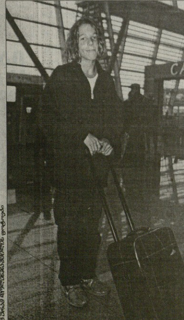
მომი ამბავია ნუმრი ლომამი