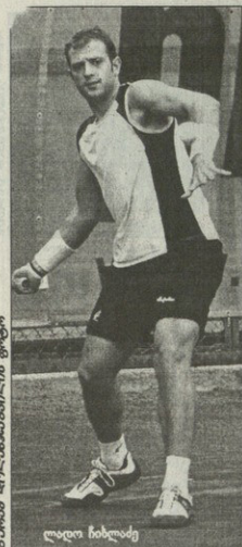
საქართველოს მატყვეობის ფორუმზე