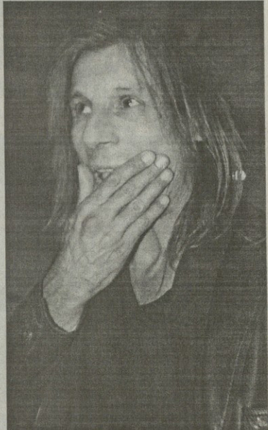
მომი ამბავია ნუმრი ლომამი