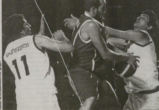
თსუ 69:81 ენერჯი-ინტელეტი