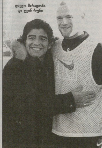
დედო მარალინა და უინ რუნი