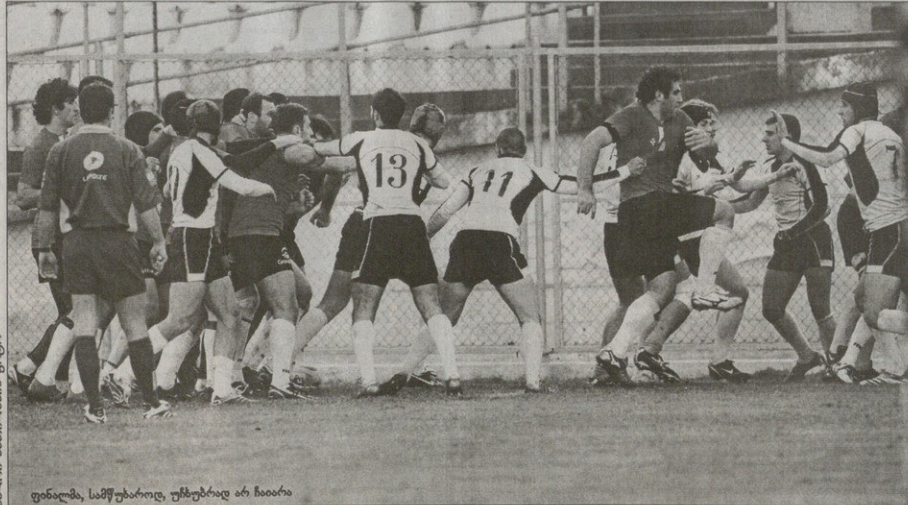
ფინალმა, სამწუხაროდ, უმწუხარად არ წაიბარა