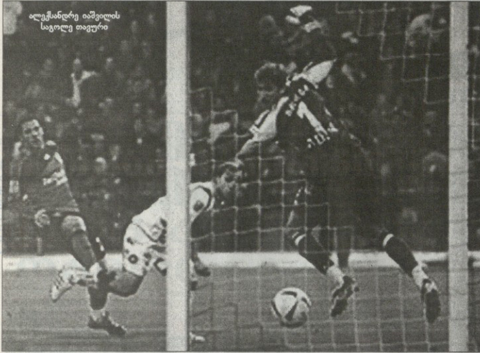
ოლეგსანდრე იაშვილის საგოლე თავარი