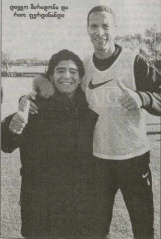
დედო მარალინა და რიი ფრედინანდი

და. იმედი მაქვს, არგენტინაში რომ ჩავა, იტყვის, დიდი ფეხბურთელი რიი ფრედინანდი ვნახეთ“. თავად სერ ალექსი „კარგი ვიზიტი იყო. ფეხბურთელებს მასთან შეხვედრა ძალიან გაუხარდათ. ვინ არის მსოფლიოს ყველა დროის საუკეთესო ფეხბურთელი, საქამათა, მაგრამ ორ-სამ საუკეთესოთა შორის ერთ-ერთი რომ არის, ფაქტია“. და არ გააჩნდებრესობ, ლოვერპულში რა მოხდა? ჯგუფი კარავერის მამამ ფოტო კარავერმა, რომელიც ინგლისის ნაკრებს მიიღო ცხოვრება თავდადებული ქობილის (და, შესაბამისად, ხელით ვატყობდი ვარსკვლავი მარალინა უნდა სძულდეს), შვილის დარეკვებ, ის ჩვენთან მოდისო, მღვდლები ტაქსი დაიჭირა და იქთან გამოვარდა თავკუდმთვლეელი. მეტიც, „ჩემ მარტო ჯერადი მეტად გაფრთხილებული, რადგან მეპატრონეებს მას მისეული მოლაპარაკებაზე დასწრების უფლება, მაგრამ ფეხბურთელებს ვაფიც, მარალინა მიღის და შემოვარდნენ. თავად მარალინა მიუდინებ არ გასულა. ბიჭებსა თვისში მაგრეს მას ის ჩემს კაპიტნზე მასკერანოზე დალაპარაკებას ცდილობდა, მაგრამ წუთი ისე არ გავიღე, ვინცის რომ არ დაეკარგებინა და არ მისაღმებოდა“.