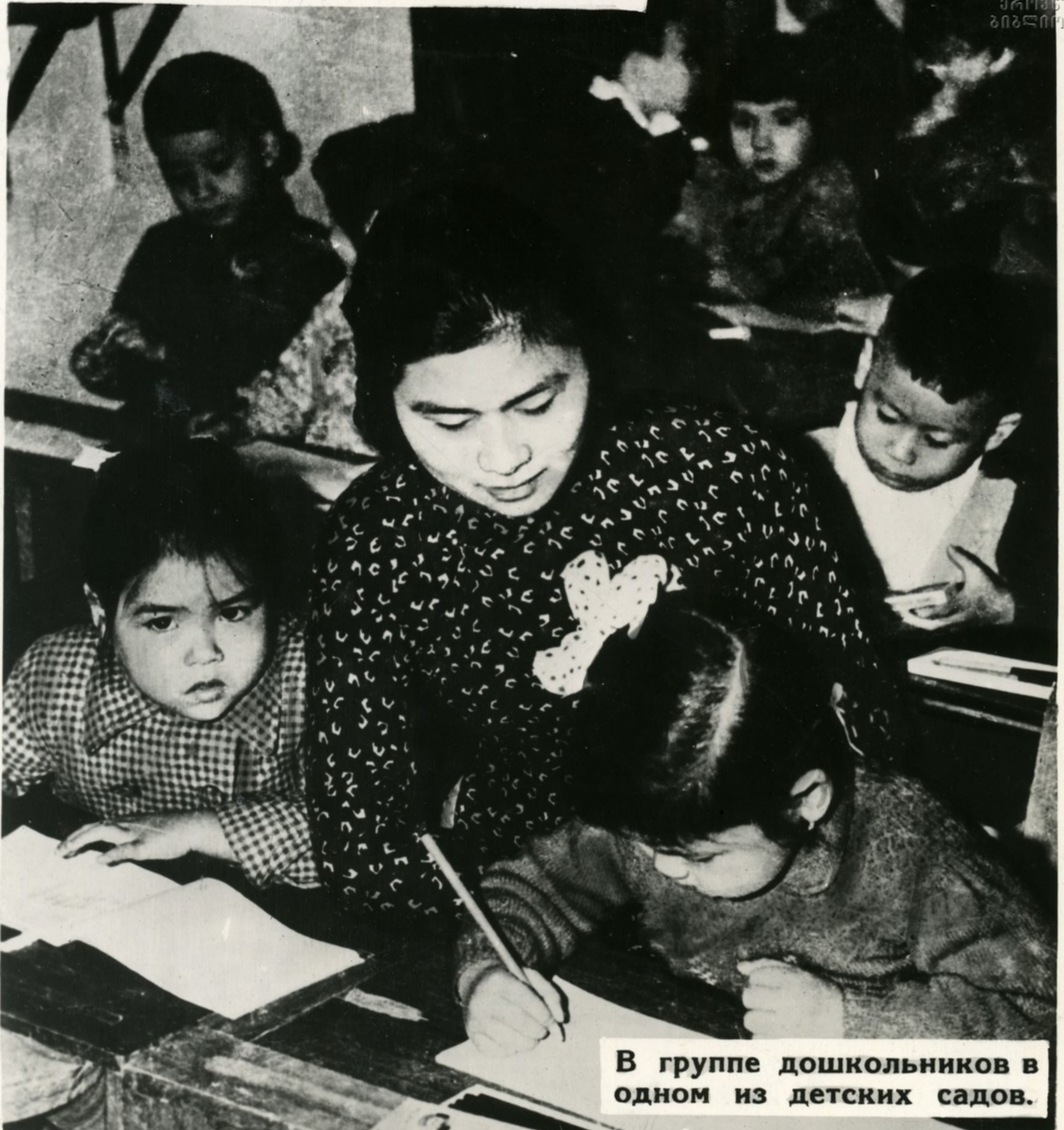
В группе дошкольников в одном из детских садов.