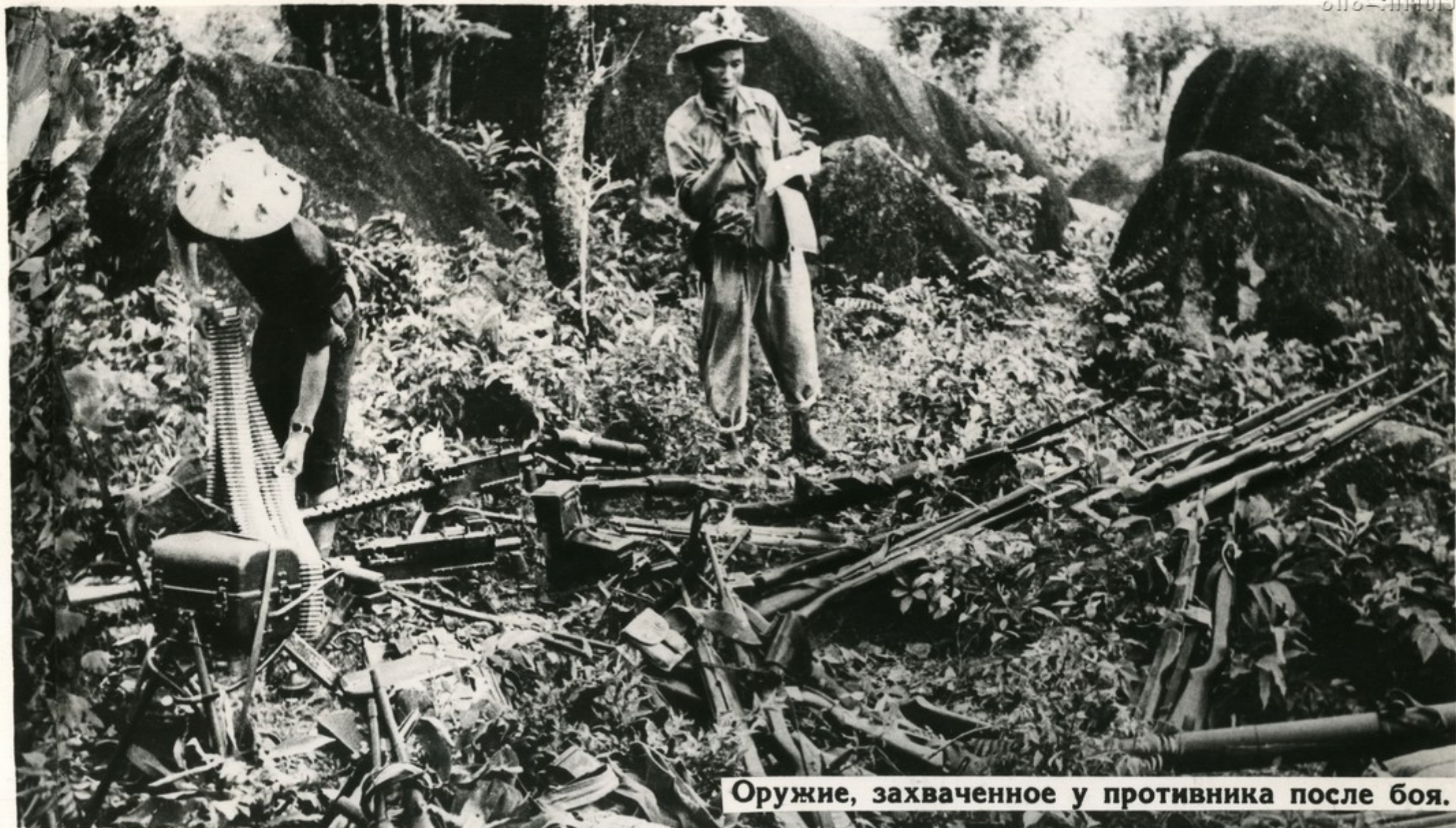
Оружие, захваченное у противника после боя.

Патриотические силы Национального фронта освобождения Южного Вьетнама проводят успешные боевые операции против американских войск и солдат сайгонской клики. Воины южновьетнамской армии захватывают богатые трофеи.