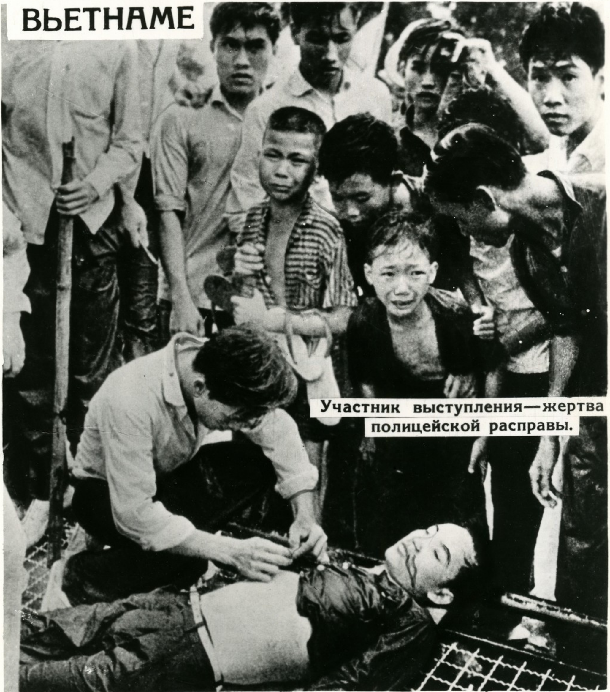
Участник выступления—жертва полицейской расправы.

Студенты и учащиеся Сайгона устроили демонстрацию протеста против вмешательства американских империалистов в дела Южного Вьетнама, за прекращение войны и репрессий против патриотов.