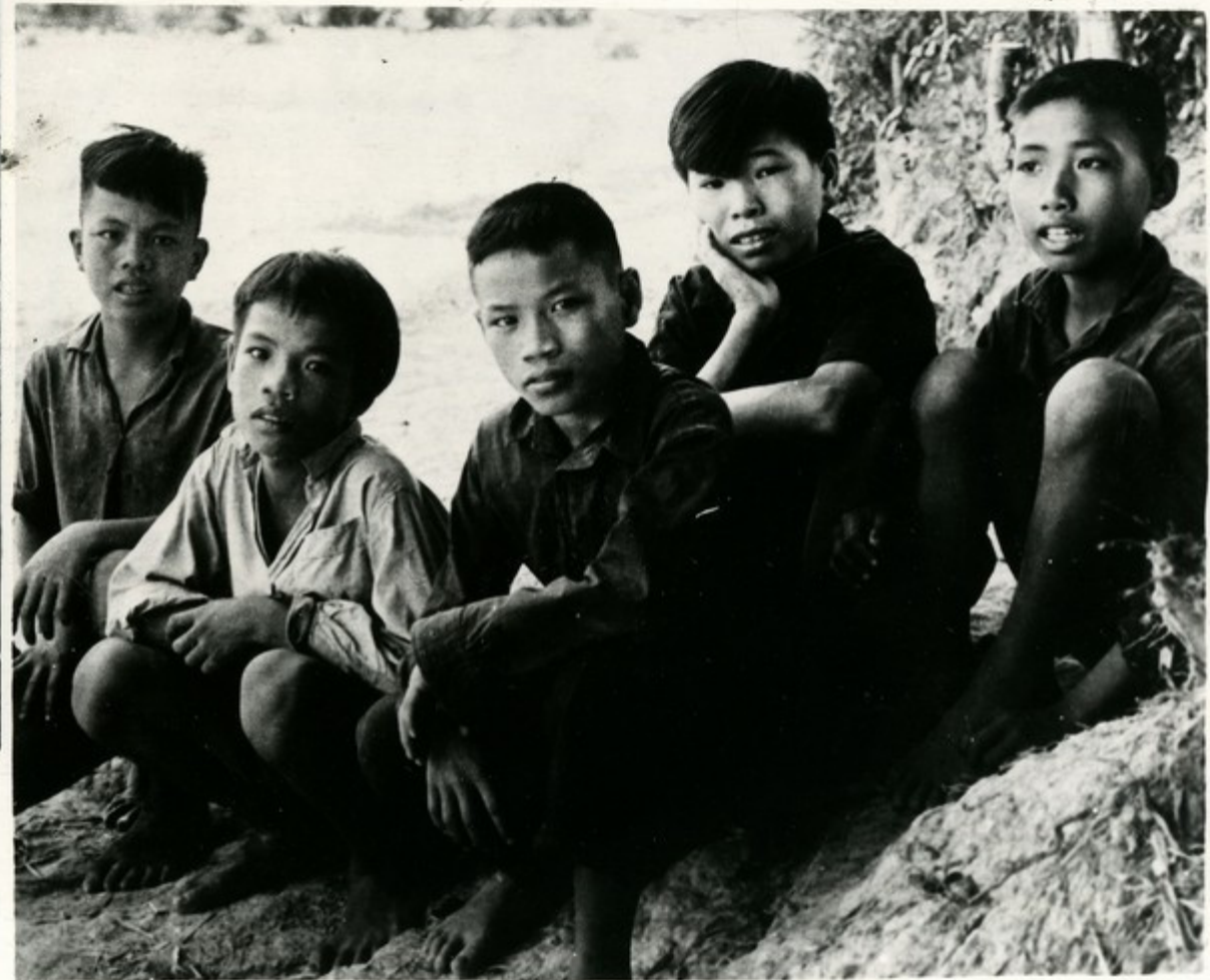
Эти юные вьетнамцы чудом уцелели во время одного из налетов, когда была разрушена их школа (слева), в которой они учились.