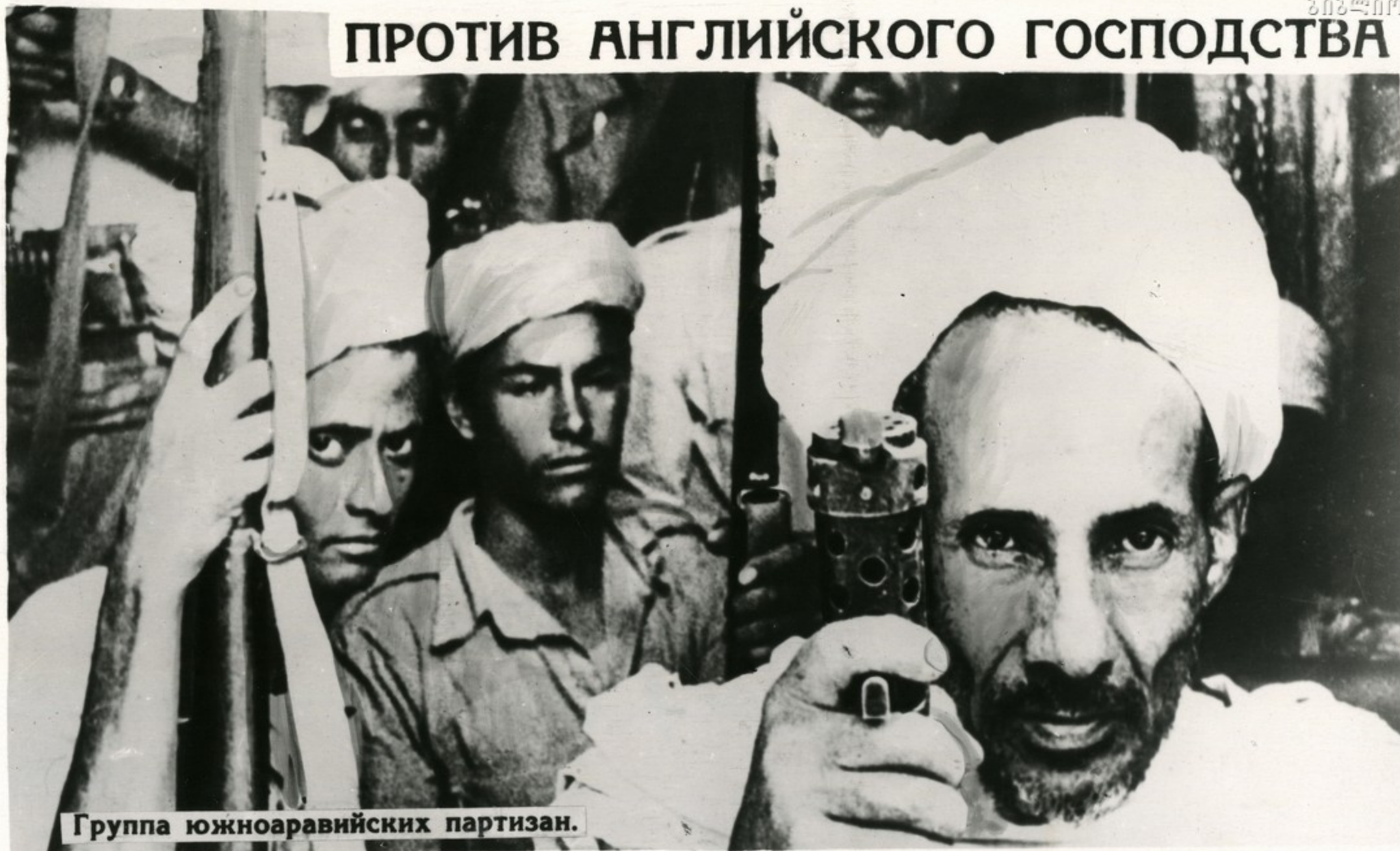
Группа южноаравийских партизан.

В Южной Аравии не прекращается борьба патриотов против английских войск. Партизаны минируют дороги, устраивают засады, нападают на военные посты.