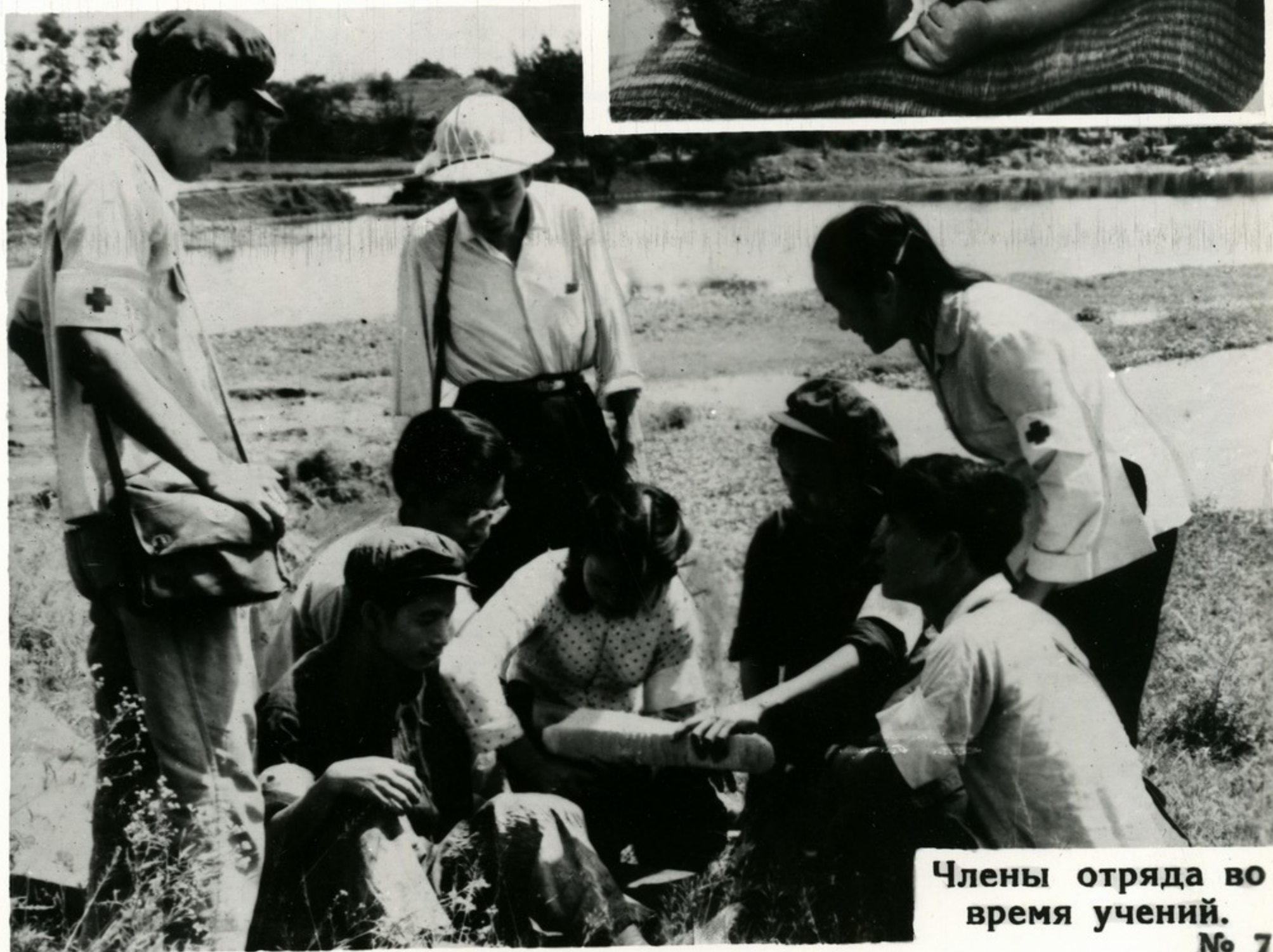
Члены отряда во время учений.