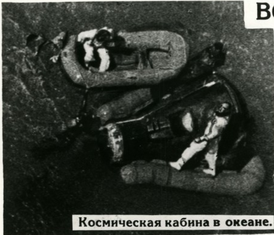
Космическая кабина в океане.

Американский космический корабль „Джеминай-5“ с космонавтами Гордоном Купером и Чарльзом Конрадом на борту успешно завершил полет и приводнился в Атлантическом океане (район Бермудских островов). С 21 по 29 августа пилоты корабля 120 раз облетели вокруг Земли, установив тем самым новый рекорд продолжительности пребывания человека в безвоздушном пространстве.