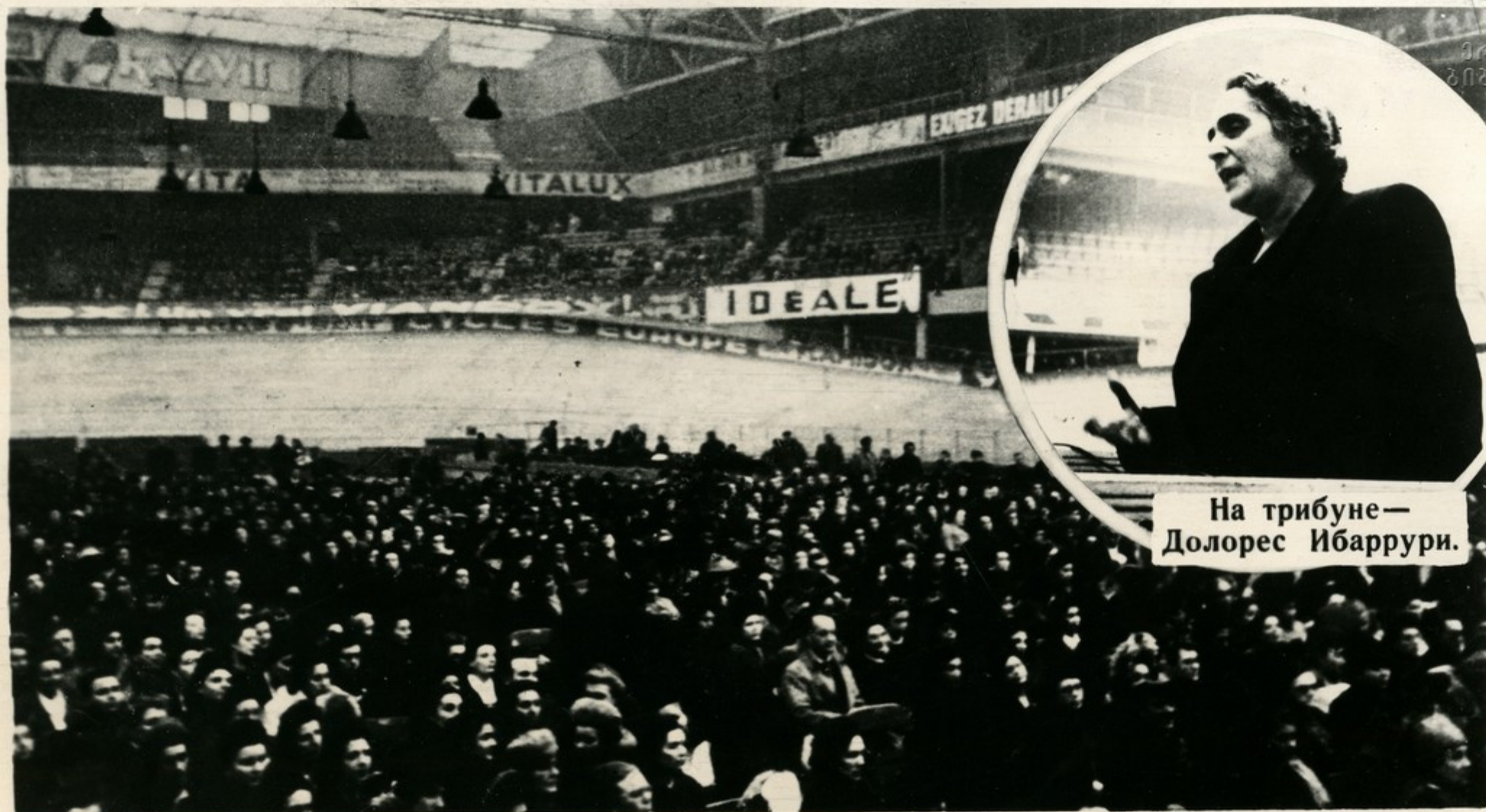
На трибуне— Долорес Ибаррури.

В Париже, после окончания Международного женского конгресса, состоялся митинг, на котором присутствовало более 15 тысяч женщин Парижа и его окрестностей. „Подруги и товарищи! — говорила в своем выступлении Долорес Ибаррури. — Здесь присутствуют представительницы различных организаций и партий, женщины разных вероисповеданий и разных интересов. Но все мы объединены благородным стремлением создать подлинную демократию, установить длительный мир, который бы обеспечил будущим поколениям жизнь, полную созидательного труда, человеческого достоинства и свободы“.