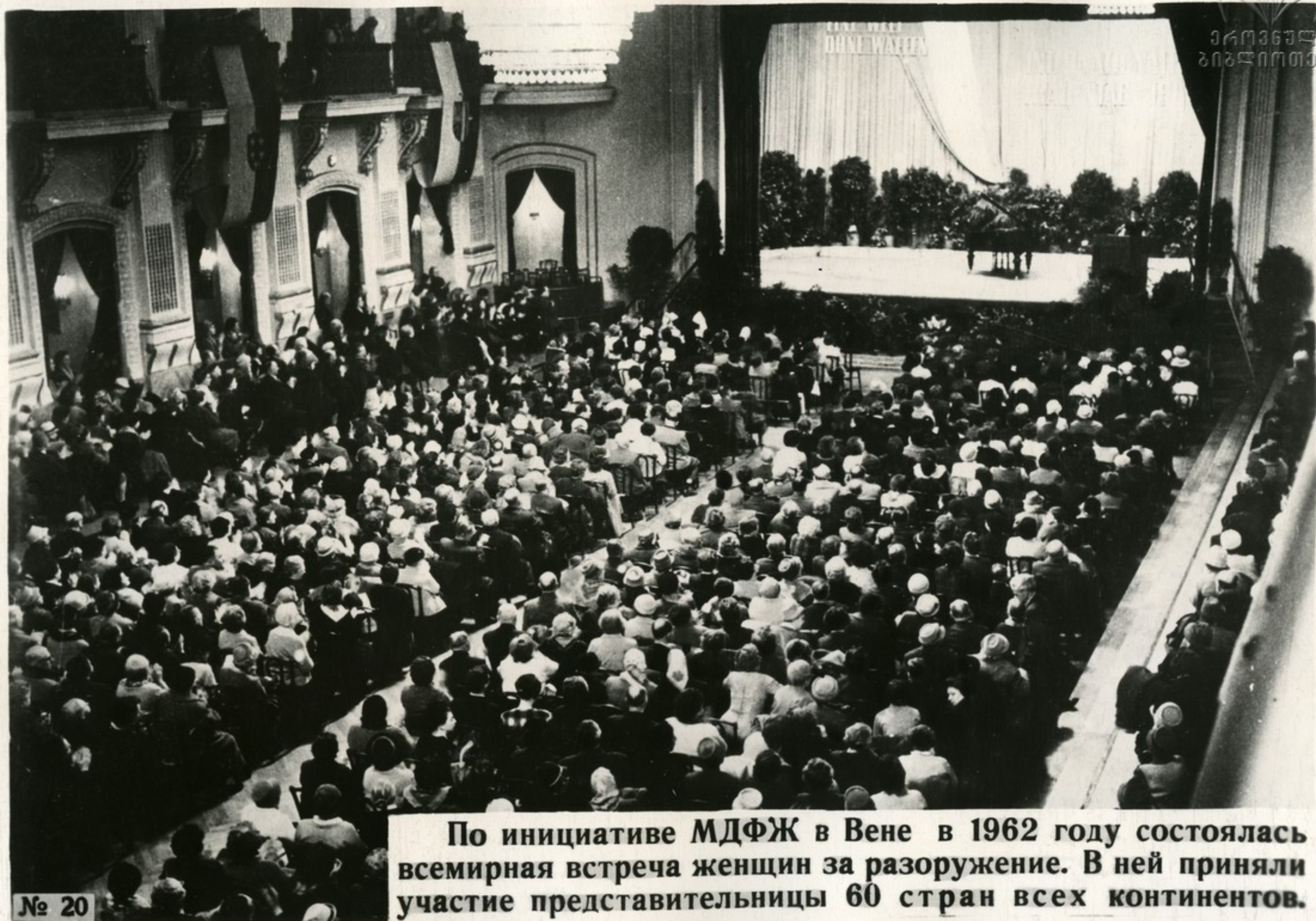
По инициативе МДФЖ в Вене в 1962 году состоялась всемирная встреча женщин за разоружение. В ней приняли участие представительницы 60 стран всех континентов.