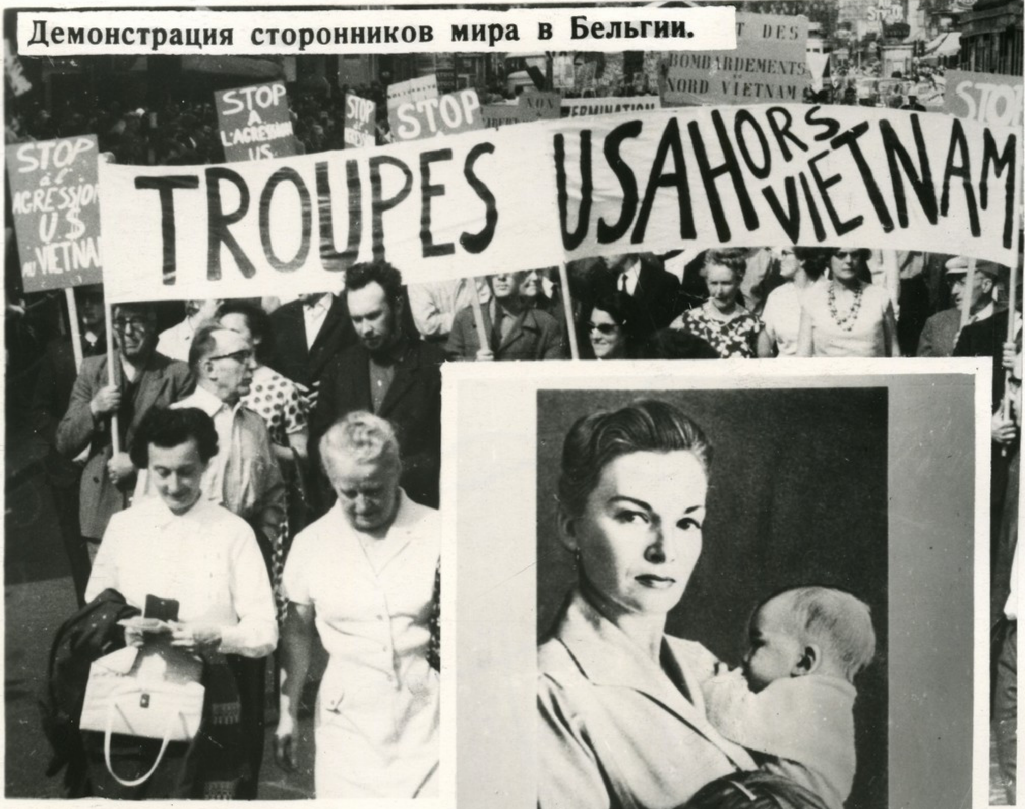
Демонстрация сторонников мира в Бельгии.

МДФЖ поддерживает все женские организации, выступающие за мир.