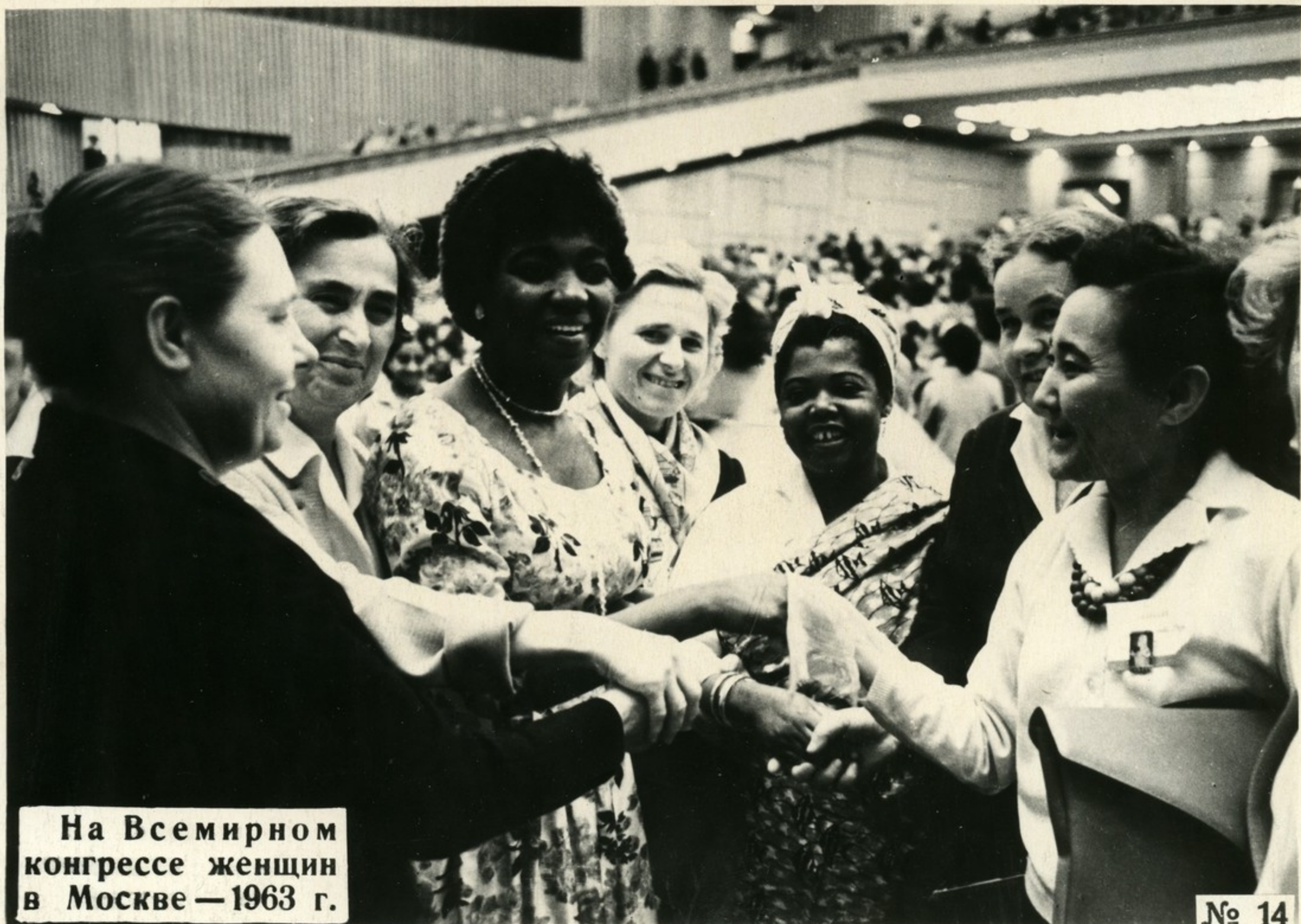
На Всемирном конгрессе женщин в Москве — 1963 г.