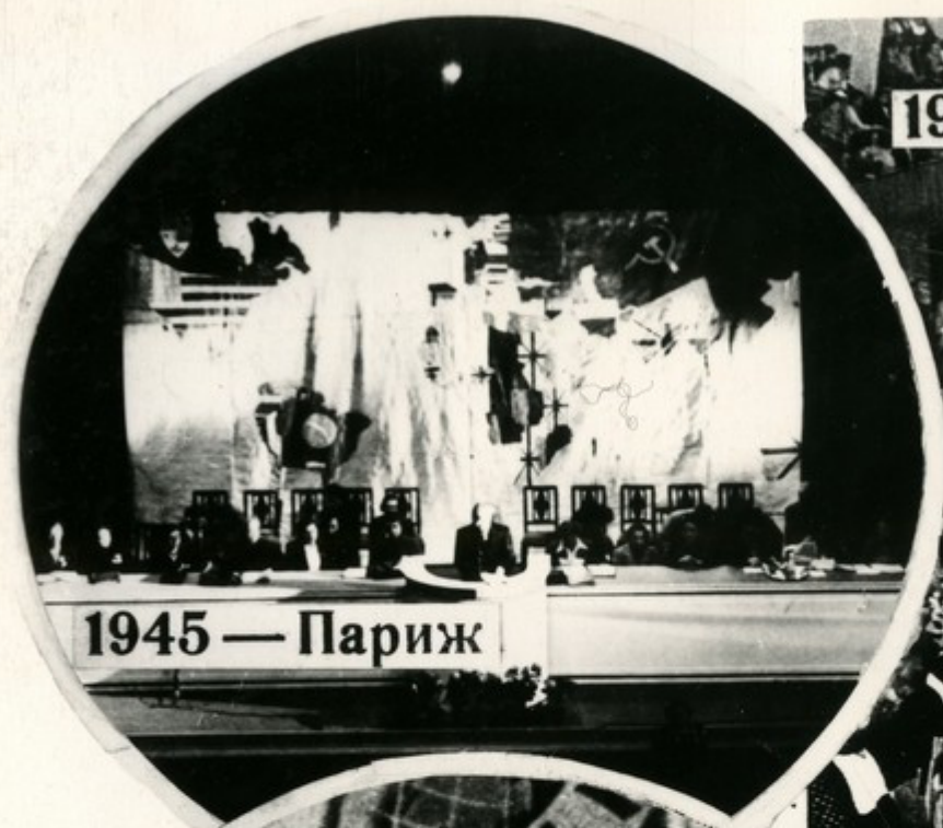
1945 — Париж