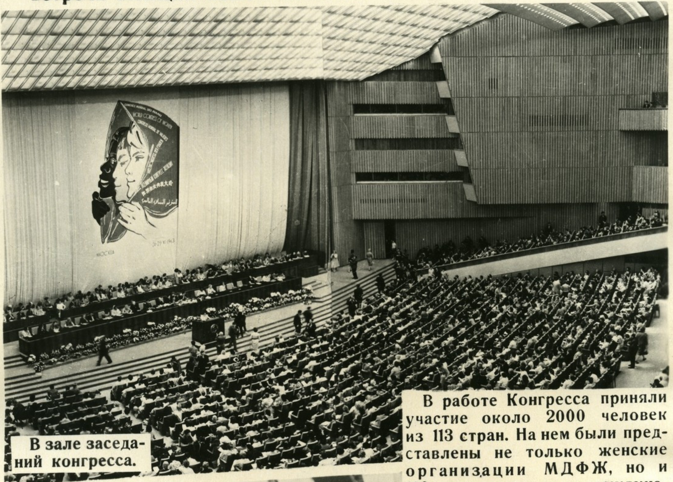
В зале заседаний конгресса.

Выдающимся событием и крупным этапом в истории международного женского движения явился Всемирный конгресс женщин, созванный по инициативе МДФЖ летом 1963 года в Москве. Это была самая представительная встреча женщин нашей планеты.