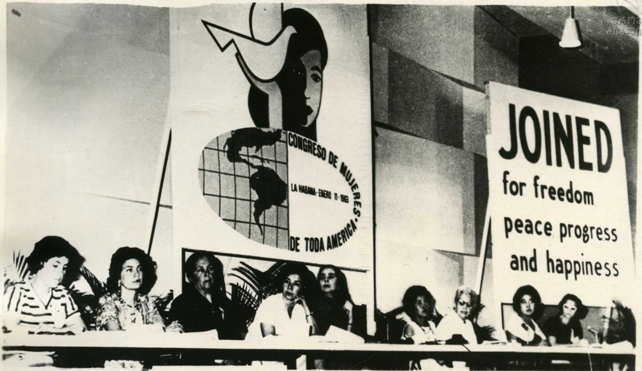
Гавана. В январе 1963 г. состоялся конгресс женщин Америки, в работе которого принимали участие представительницы МДФЖ.