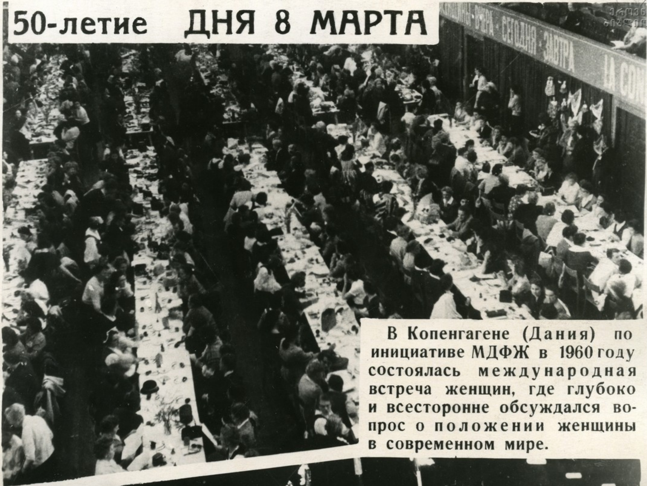
В Копенгагене (Дания) по инициативе МДФЖ в 1960 году состоялась международная встреча женщин, где глубоко и всесторонне обсуждался вопрос о положении женщины в современном мире.