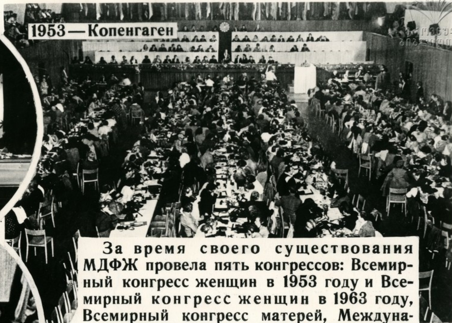
1953 — Копенгаген

За время своего существования МДФЖ провела пять конгрессов: Всемирный конгресс женщин в 1953 году и Всемирный конгресс женщин в 1963 году, Всемирный конгресс матерей, Международную встречу женщин в Копенгагене по случаю 50-летия Международного женского дня. По инициативе Федерации и при ее активном участии состоялись международные женские конференции по разоружению, Международная конференция в защиту детей, встречи, семинары, совещания.