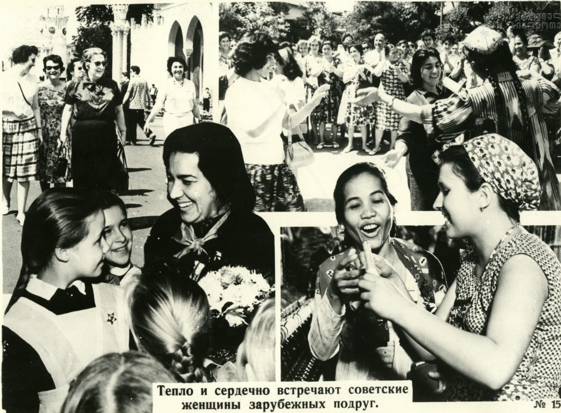
Тепло и сердечно встречают советские женщины зарубежных подруг.