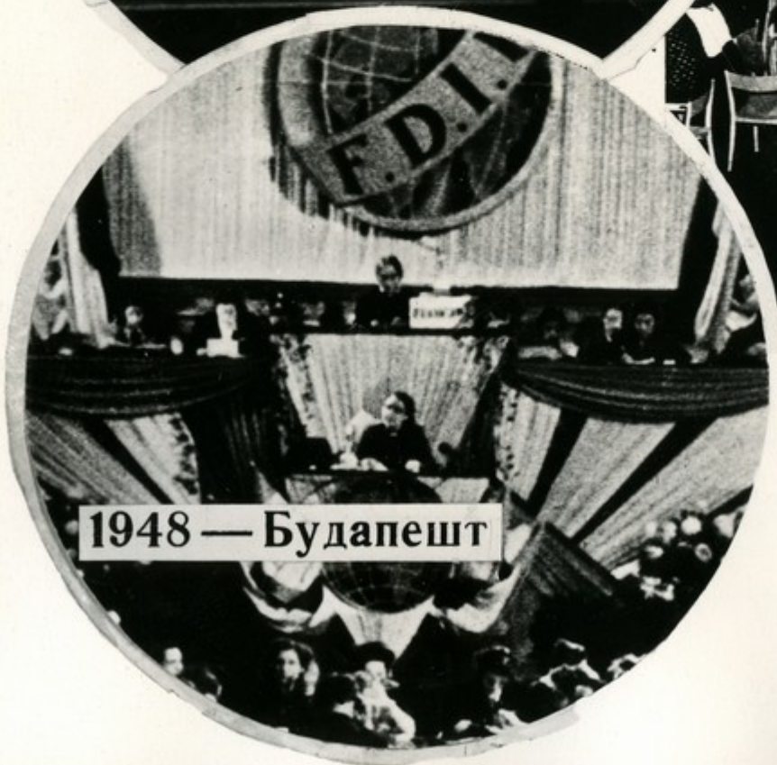
1948 — Будапешт