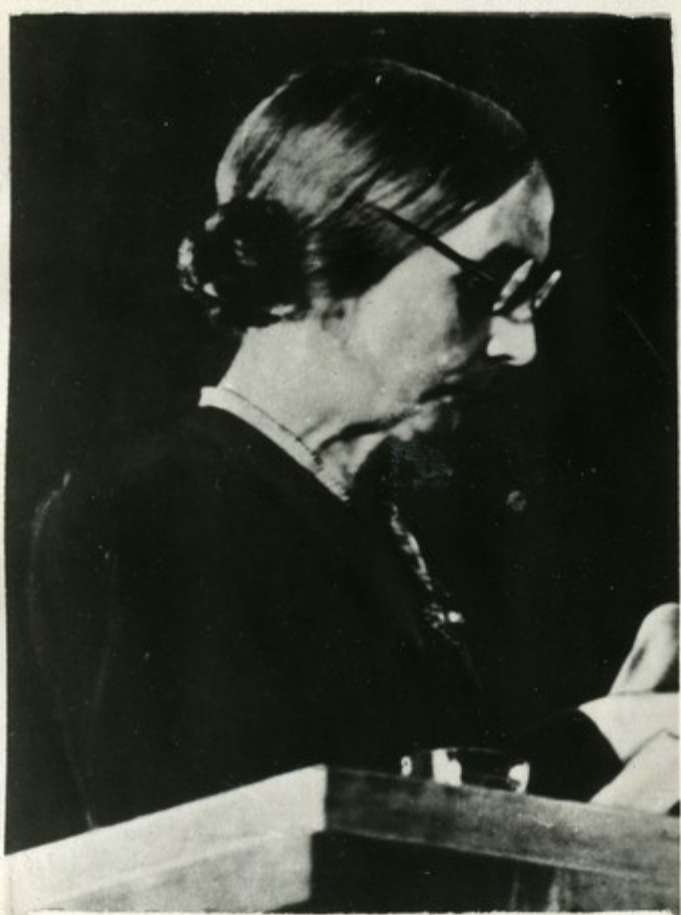
Председатель МДФЖ Эжени Коттон.