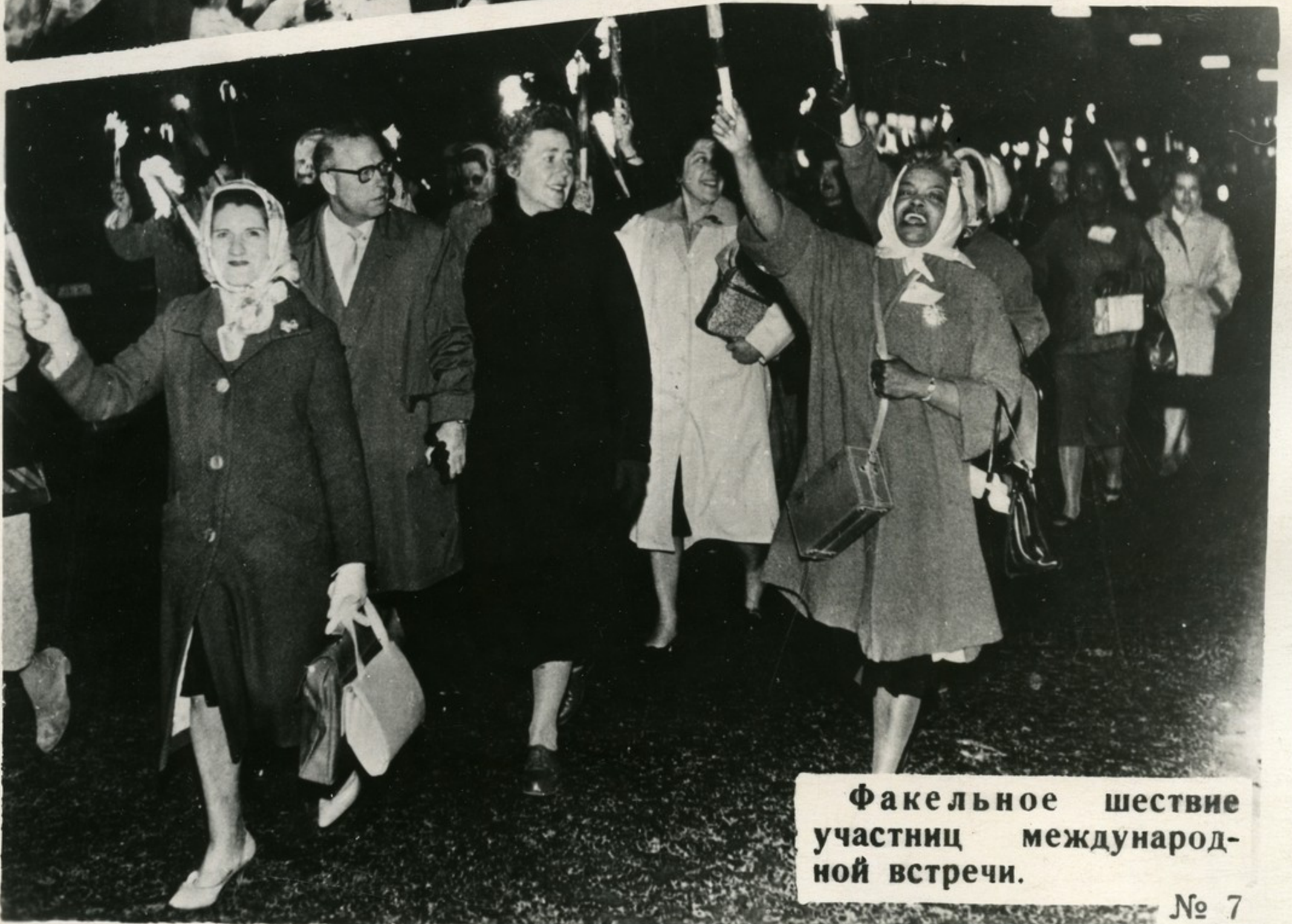
Факельное шествие участниц международной встречи.