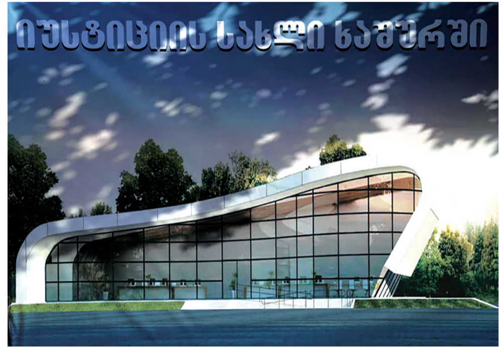
იუსტიციის სახლი ხაშურში

პრობაციონერებს „პრობოქსით“ სარგებლობა ამ დროისთვის 7 მუნიციპალიტეტში შეუძლიათ. მოწყობილობა ბათუმის, ქუთაისის, თბილისის, თელავის, გორისა და ზუგდიდის შემდეგ ხაშურის მუნიციპალიტეტშიც არის ხელმისაწვდომი; ეტაპობრივად კი, მთელი ქვეყნის მასშტაბით განაწილდება.