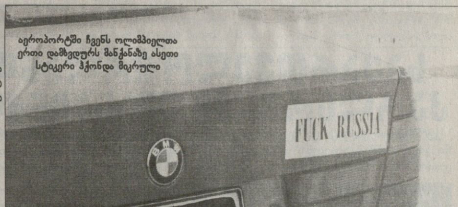
აერობორტში ჩვენს ოლიმპიელთა ერთი დამზედურს მანქანაზე ასეთი სტიკერი ჰქონდა მიერული