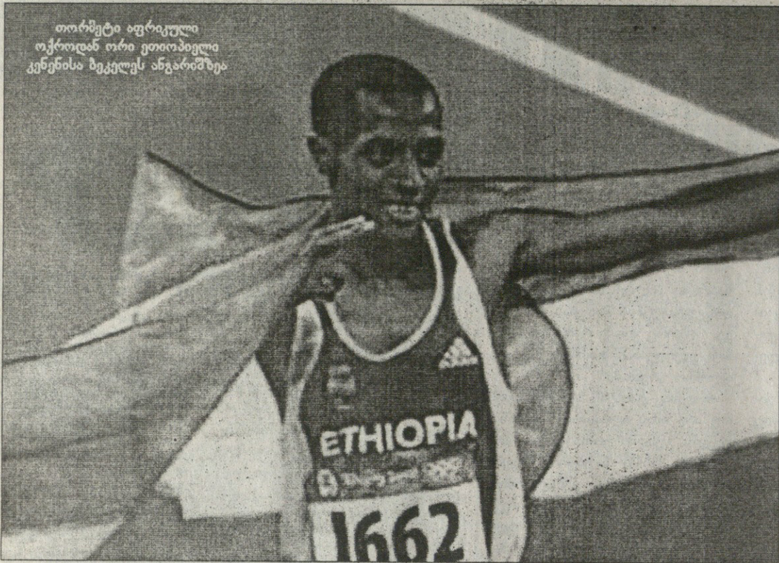
თორმეტი აფრიკელი ოქროს ორი ეთიოპელი კენენისა ბეგელეს ანგარიშზე