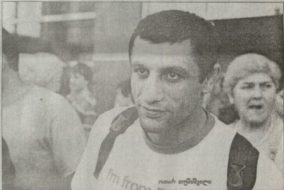
გადამრეცხველი კომპიუტერის ფოტო