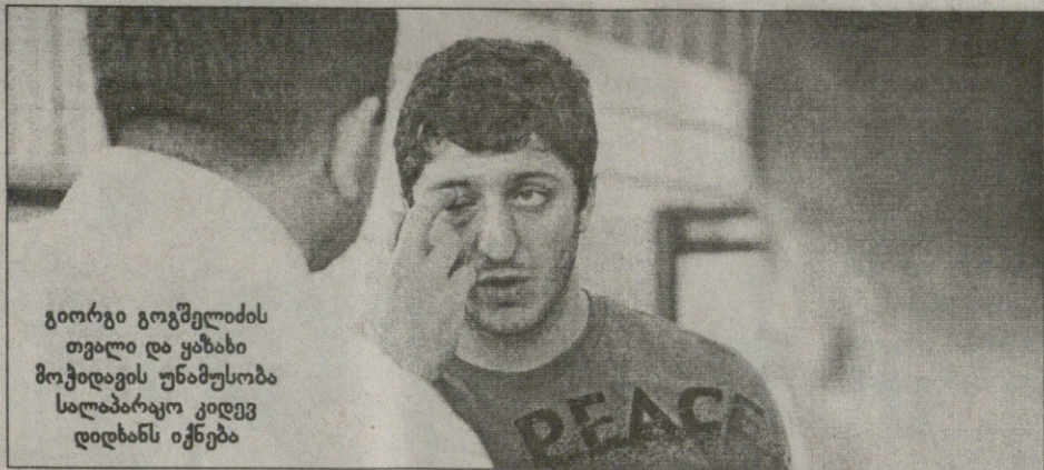
გიორგი გოგშელიძის თვალი და ყაზახი მოჭიდავის უნამუსობა სალაპარაგო კიდევ დიღხანს იქნება