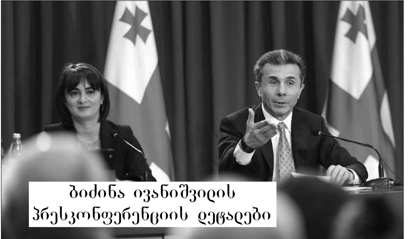
ბიძინა ივანიშვილის პრესკონფერენციის დეტალები