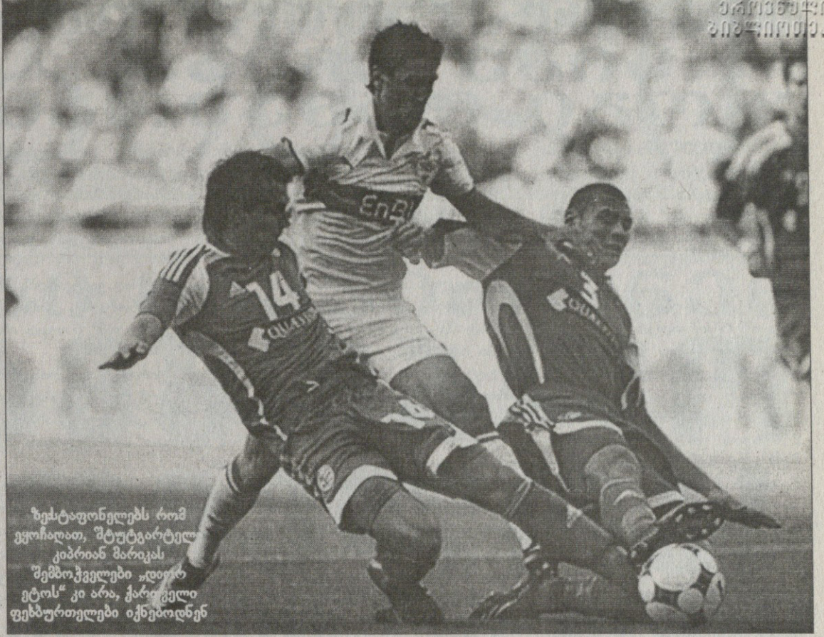
ზეტაფონენებს რომ ევოლირდეს, შტუტგარტელ კიპრისან მარკას „შემოქმედებები“ „ლიტორეტოს“ კი არა, ქართველი ფეხბურთელები იქნებოდნენ