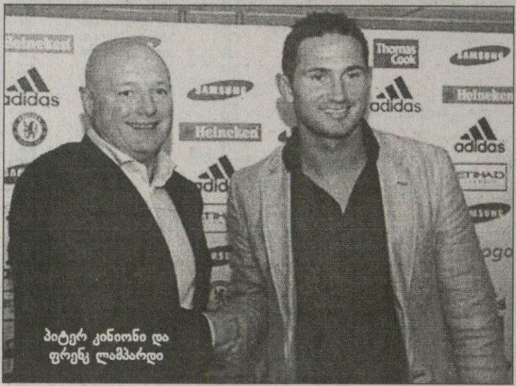
პეტერ კინიონი და ფრენკ ლამპარდი