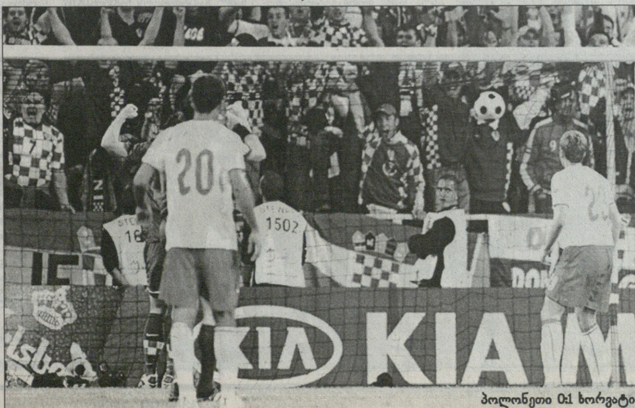
პოლონეთი 0:1 სლოვატია

სლოვატია — თურქეთი პორტუგალია — გერმანია ჰოლანდია — შვედეთი ან რუსეთი ესპანეთი — რუმინეთი, იტალია ან საფრანგეთი