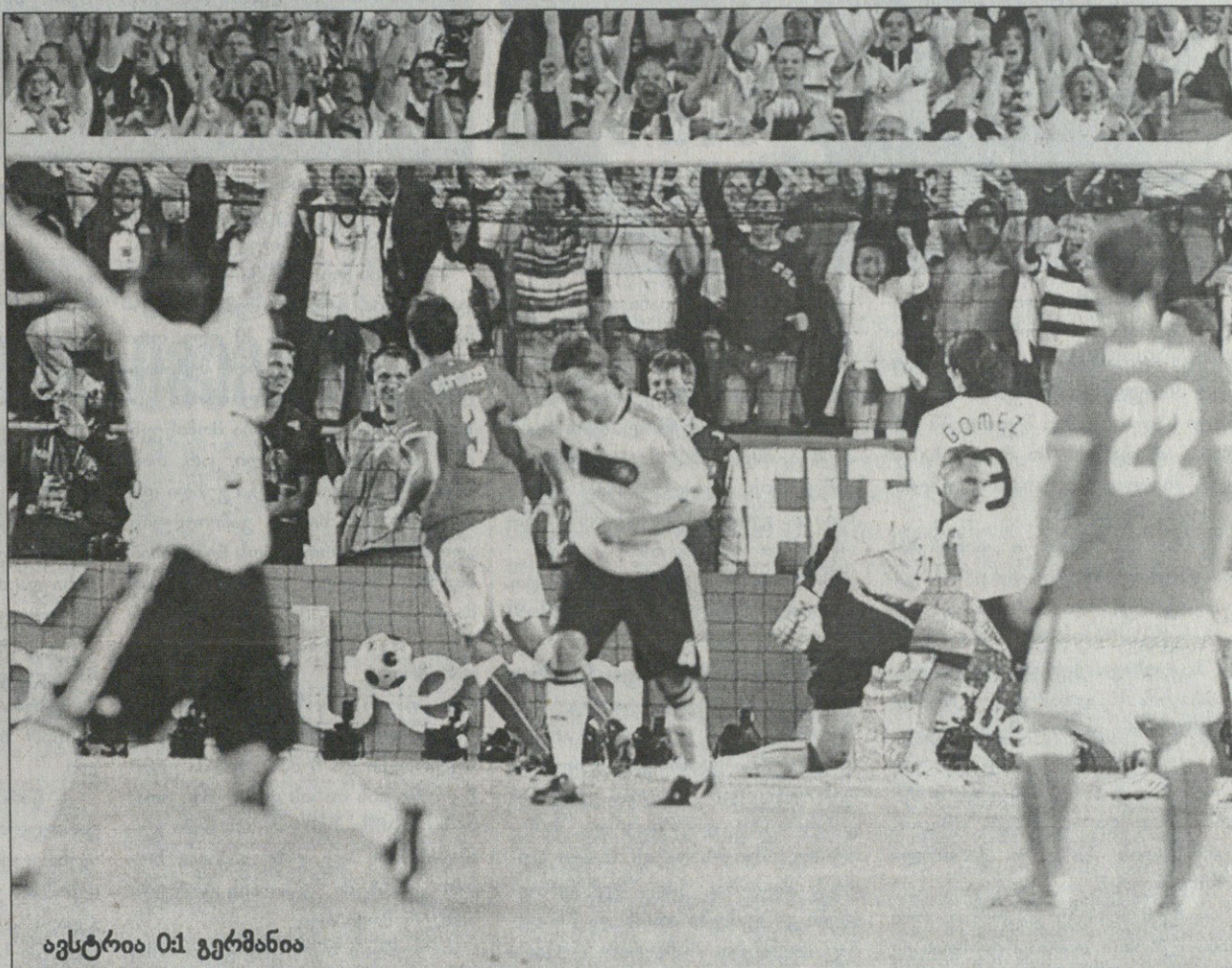
ავსტრია 0:1 გერმანია