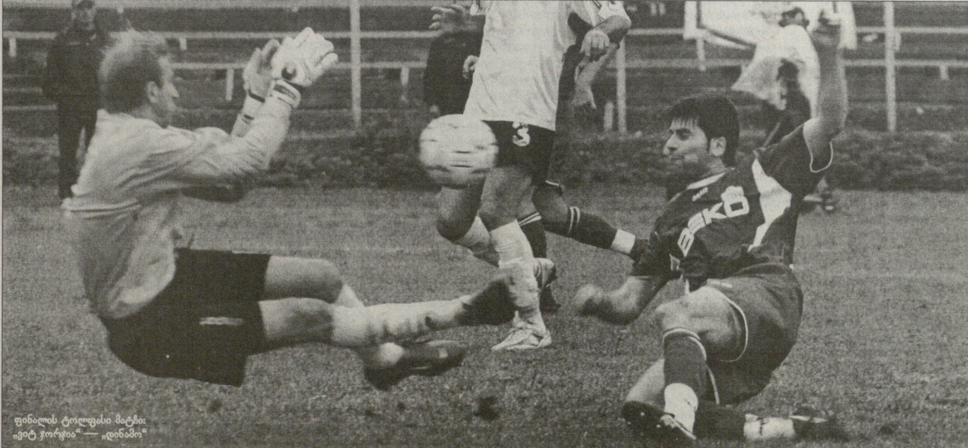
ფინალის ტოლფასი მატჩი: „ვიტ ჯორჯია“ — „დინამო“