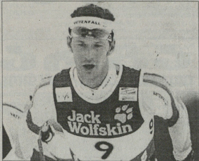
მსოფლიოს თასი. პოლენკოლენი. ნორვეგია. 8 მარტი