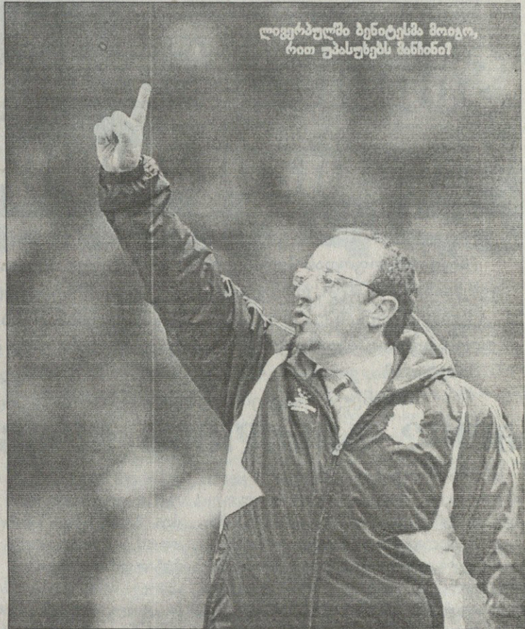
ლივერპულში ბენიტესმა მოიგო, რით უპასუხებს მანჩინი?