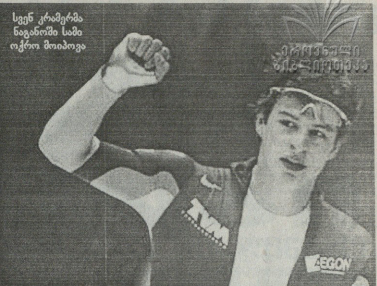
მსოფლიოს ჩემპიონატი ცალკეულ დისტანციებზე. ნაგანო. იაპონია. 4-9 მარტი

ამ ორი გამარჯვებით შლირენსაუერმა მყარად მოიკიდა ფეხი საერთო ჩათვლის მეორე საფეხურზე. მის წინ მხოლოდ მეორე ავსტრიელი ტომას მორგენსტერნია, რომელმაც კარგა ხნის წინათ გაინაღდა მსოფლიოს თასის გამარჯვებულის წოდება.