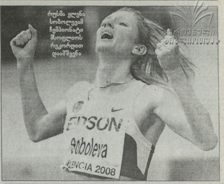
მსოფლიოს ჩემპიონატი. ვალენსია. ესპანეთი. 7-9 მარტი

საშხაბი ჭოკიტი ხტომბა: 1. ვეგენი ლიკუანენკო (რუსეთი) 5,90 მ; 2. ბრედ უოლქერი (აშშ) 5,85; 3. სტივენ ჰუკერი (ავსტრალია) 5,80; 4. უერომ კლავიე (საფრანგეთი) 5,75; 5. ტიმ ლობინგერი (გერმანია) 5,70 400მ: 1. ტაილერ კრისტოფერი (კანადა) 45,67 წმ; 2. იოჰან ვაისმანი (შვედეთი) 46,04; 3. კრის ბრაუნი (ბაჰამის კუნძულები) 46,26; 4. ნერი ბრენი (კოსტა რიკა) 46,65; 5. მაქსიმ დულდინი (რუსეთი) 46,79 800მ: 1. ბრაიან კლეი (აშშ) 6371 ქულა; 2. ანდრი კრაუჩანკა (ბელარუსი) 6234; 3. დმიტრი კარპოვი (ყაზახეთი) 6131; 4. მიხაილ ლოგვინენკო (რუსეთი) 5984; 5. დონოვან კილმარტინი (აშშ) 5951 3000მ: 1. ტარიკუ ბეკელე (ეთიოპია) 7 წთ 48,23 წმ; 2. პოლ კიხსილე კოეჩი (კენია) 7.49,05; 3. აბრაჰამ ჩერკოსი (ეთიოპია) 7.49,96; 4. ედვინ ჩერიოტ სოი (კენია) 7.51,60; 5. კრეიგ მოტრემი (ავსტრალია) 7.52,42 სამხტომბი: 1. ფილიპ იდოვუ (ბრიტანეთი) 17,75 მ; 2. არნი დავიდ ხირატი (კუბა) 17,47; 3. მელსონ ევორა (პორტუგალია) 17,27; 4. ფაბრიციო დონატო (იტალია) 17,27; 5. დმიტრი ვალუკევიჩი (სლოვაკეთი) 17,14 800მ: 1. აბუბაქარ კაკი ხამიზი (სუდანი) 1 წთ 44,81 წმ; 2. მზულაენი მულაუხი (ს. აფრიკა) 1.44,91; 3. იუსუფ საადა ქამელი (ბაჰრეინი) 1.45,26; 4. დმიტრის მილკევიჩი (ლატვია) 1.45,72; 5. დმიტრი ბოგდანოვი (რუსეთი) 1.45,76 4X400მ: 1. აშშ (დევისი, ტორენსი, ნიქსონი, ვილი) 3 წთ 06,79 წმ; 2. იამაიკა (ბლეკუდი, სტილი, ფინდლეი, ბარეტი) 3.07,69; 3. დომინიკის რესპუბლიკა (რეგუერო, სანტა, მესია, ტაპია) 3.07,77; 4. პოლონეთი (კედ-ზია, კლინჩაკი, ჩუბინსკი, სობინსკი) 3.08,76; 5. ბრიტანეთი (გრინი, ბაკი, გარლანდი, ტობინი) 3.09,21