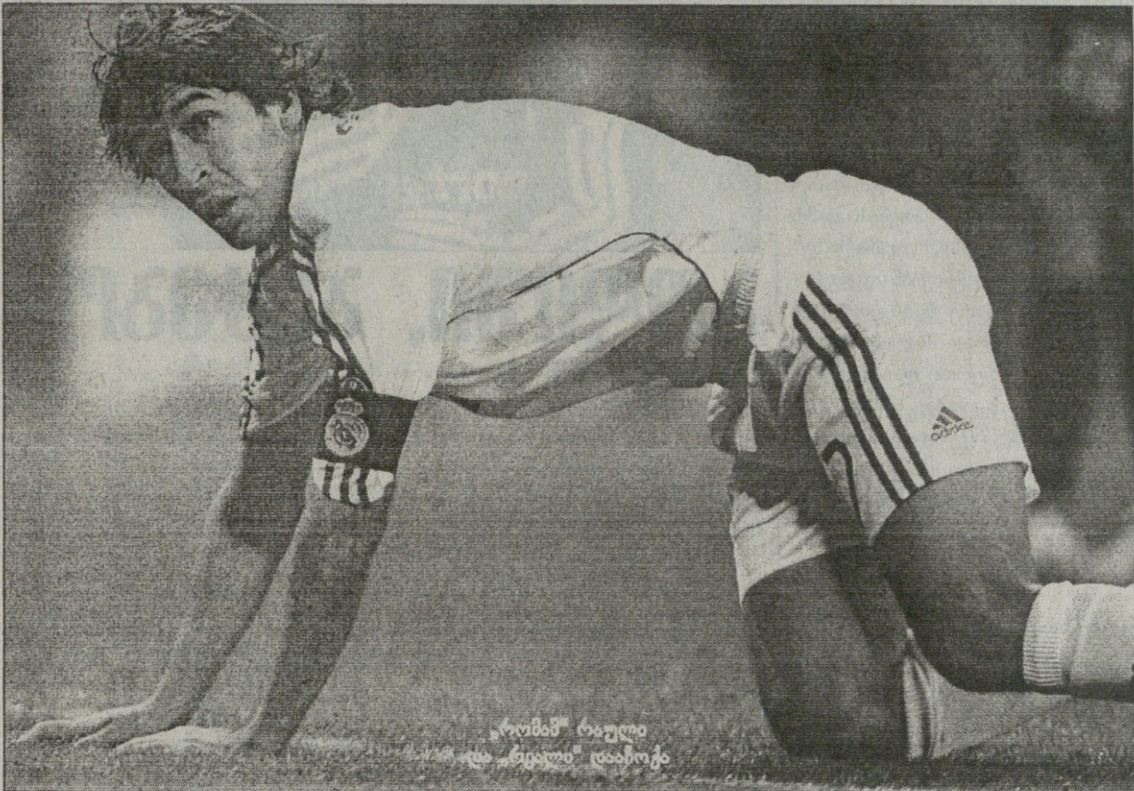
რომან რეალი ორჯერ დაჯაბნა