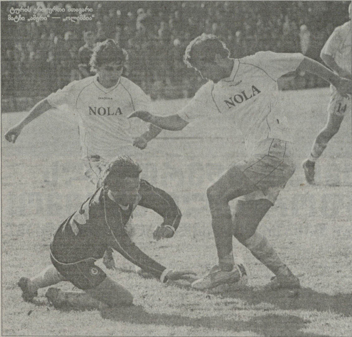
ტურის ერთ-ერთი მთავარი მატჩი „ამერი“ — „ოლიმპია“