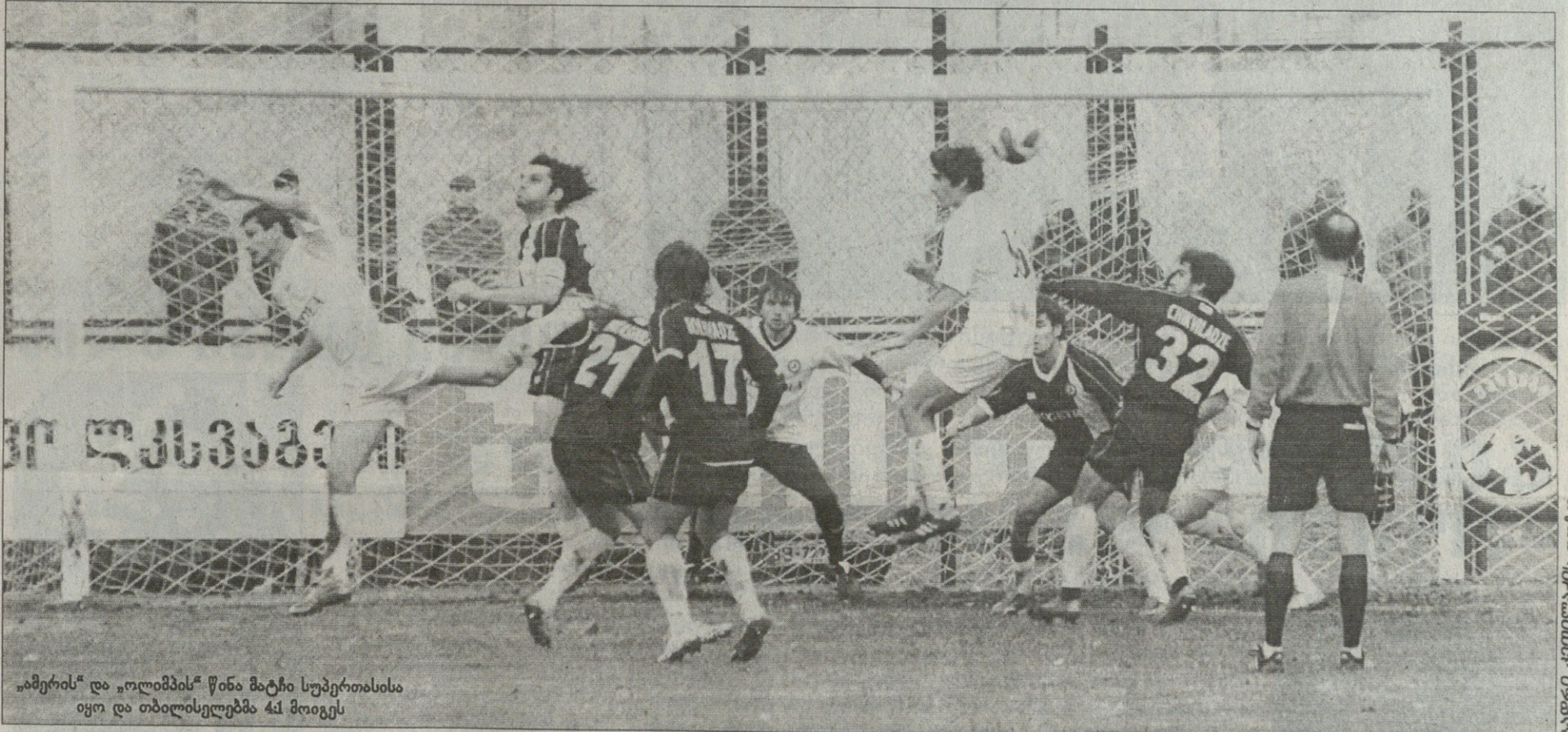
„ამერის“ და „ოლიმპის“ შინა მატჩი სუპერთასისა იყო და თბილისელებმა 4:1 მოიგეს