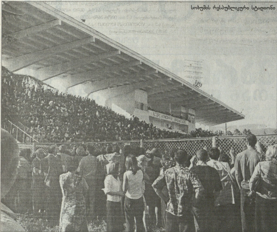
სოხუმის რესპუბლიკური სტადიონი

საპარატისტული აფხაზეთი და ფეხბურთი — ვფიქრობთ, ეს საინტერესო თემა უნდა იყოს ქართველი გულშემატკივრისთვის. აფხაზეთის დეფაქტო ფეხბურთის ფედერაცია უკვე რამდენიმე წელია, ჩემპიონატს და თასის გათამაშებას ატარებს.