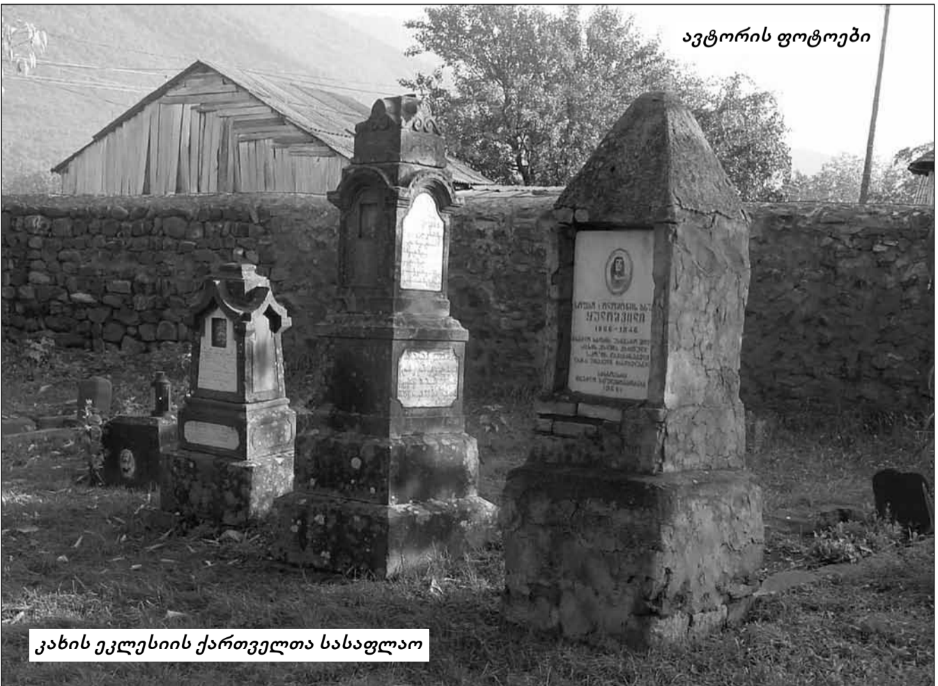
კახის ეკლესიის ქართველთა სასაფლაო

კახის რაიონის ქართველთა სახელით. 1971 წელი