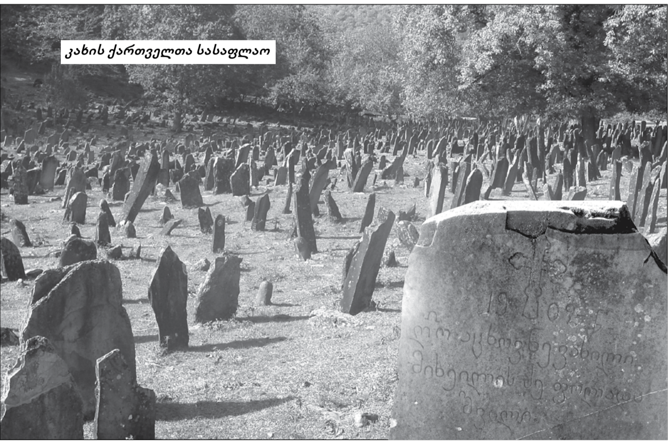
კახის ქართველთა სასაფლაო

როგორც ზემოთ ითქვა, გასაბჭოების დროს ინგილოთა ნაწილი ქრისტიანი იყო. ამ პერიოდში ყველა ქრისტიანული და მუსულმანური სამლოცველოები დაიკეტა. გარკვეული