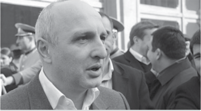
ვანო მერაბიშვილი ხელისუფლებას „ნაციონალურ“ გამოცდილების გაზიარებას სთავაზობს