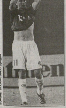
ბაიერი ამონიულარსი მტვტი