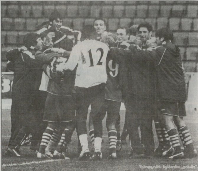
შემდგომის ჩემპიონი „დინამო“