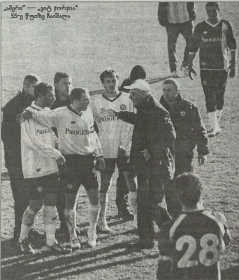
ამერი — ევტ ჯორჯია 55-ე წუთზე ჩაბნა