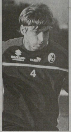
სინტამუსი და, ცოცხალ არ იყოს, სესსავარი ინჟინრმა: ფეხბურთელი, რომელმაც მჭირ ბუნდელივის პრემიაში ოდენ 8 წუთი თამაში, ინგლისური პრემიერლიგის გუნდში გადადის.