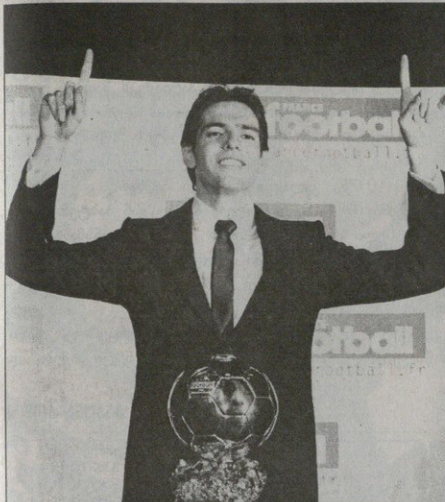
მოქალაქე არაფერი მისმარა ის რაზეც ლამაზი კერა ხნის წინ დაწყო, გუნდის თვითკალურად გაცხალდა „მილანის“ ბრაზილიელი ფეხბურთელი კაკა

როგორც ვიცი, ითვლებოდა, წელს მსოფლიო ჯილდოდ იქცა, რაკია „ფრანს ფუტბოლმა“ გვირავთა გაყვითლება „ოქროს ბურთის“ მფლობელი მსოფლიოს ნებისმიერ ლეგიონ მოთამაშე ნებისმიერ ეროვნების ფეხბურთელ შეიძლება გახდეს, ვინცის წევრები კი არა მხოლოდ ევროპულზე, უკვე სხვა კონტინენტებზეც არიან. ესეც გავიხსენოთ, რომ „ფრანს ფუტბოლის“ გამოკითხვებში მდიდრები, გამომცემლები და რედაქტორები მონაწილეობენ — თითო ქვეყანას თითო გამომცემელი-რედაქტორი წარმოადგენს. და ჩვენთვის ცხელზე სასამართლო და სასაყურად „ფრანს ფუტბოლის“ გამოკითხვებში საქართველოდან „საბრძოლის“ გამომცემელი ზურაბ ფოცხვანი იღებს მონაწილეობას ეს ამბები 1994 წლიდან იღებს დასაბამს. წლის ტრიუმფატორს კი ვიცი, მისი მიღების თქვა „ოქროს ბურთის“ მოპოვების ერთადერთი გზა ის არის, რომ დიდი და მებრძოლი გუნდის წარწლი იყო ამიტომაც, უფროსი მაგისტრის გუნდი ჩვენს თავს უნდა უნდა და მწერებლებს „მლანში“ და ბრაზილიის ნაკრებში“.