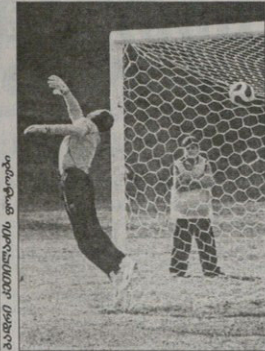
საქართველო საფეხბურთო ფედერაცია