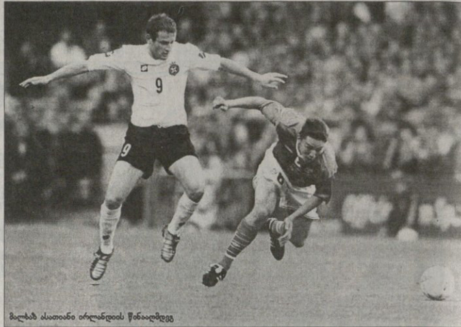
მატაბს ასათიანი ირანდის წინააღმდეგ

სხვათადაც კი ვაგვივთა ქალაქ ვაძირდებოდა კატებს კლებს აჭიან, რადგან ძლიან მარტებს არან და მამობის სუხსან სადამონ არც შეიძლება მალე შეხებდნენ თბილ თბებში. კობე უჩოხია