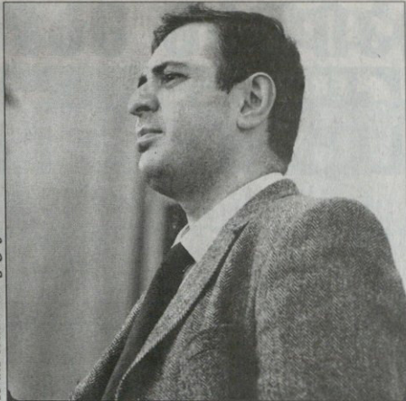
საპროტესტო მანიფესტაციის მონაწილე