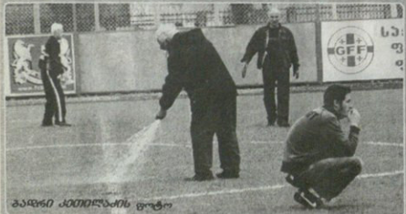
მოდანს მორწყვა დაიბაჯ, სქირდება, ილიდრ აქ სულ სხვა ამბავია ზუგდიდში „მგლებას“ და „მერის“ მატჩის წინ სტუმრებს ერთ-ერთი საჯარიმო მოედანი თვალში ეტარება...