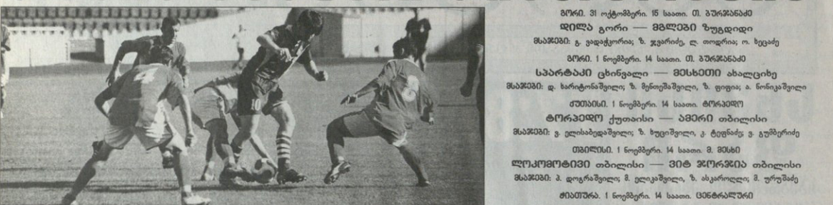
დღეს-ვალ დავით ყიფიანის სახელობის საქართველოს თანის „ყაზბეგის“ გათავაშების ჯგუფური ეტაპის მეოთხე ტურის მატჩები...