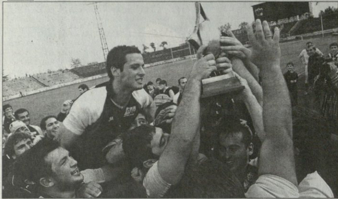
მალაზა ზ. ახალაბიძის/მთავრის ფოტოგრაფი