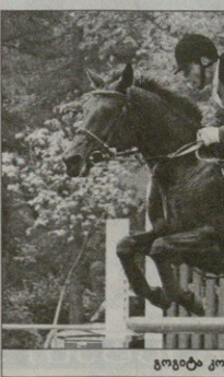
გეგმვა კოლვა და „გაღვირავი“