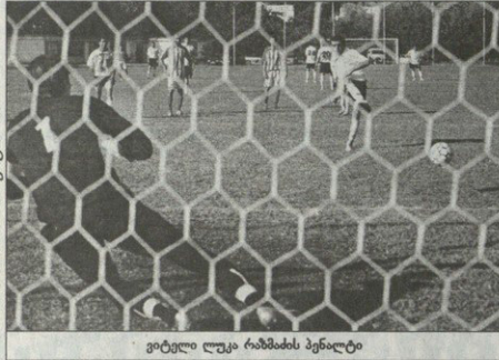
ვიტალი ლუკა რამისის პენალტი

მსხმენი: 7 ოქტომბერი, 15 საათი, პრაზნი, 300 მაყურებელი