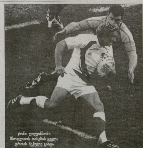
ჯონი უილკინსონი მსოფლიოს თასების ყველა დროის მექულე გახდა

და, მეორე ტაიმში ვაილი ჯონიზე ნაღობმა გაჩაღდა. თორმეტკერი ნაბერაკები ინგლისელთა ათ ნო-მერს ბეერი სიღის მავრამ ბენ-კეი, პირად მცველით ადვიდა უილკინსონს და ცივი ნიავი რა სათქმელია, ავსტრალიელთა ტო-რებზეც არ მიაკარა. „იულო-მაკ“ თავისი საქმე გააკეთა, თო-რმეტვე ქულა თავად უთავაზა ავ-სტრალიელებს და მინ გაისტუ-შრა. ამასთან უილკინსონი მსოფ-ლიოს თასების ყველა დროის მე-ქულე გახდა. მესამე მსოფლიოს თასზე მას 234 ქულა დაფერო-ვდა, რითაც გადაასწრო ლეგენ-დარულ შტრლიანდელ გვეინ მ-სტინგს. ასტინგს უილკინსონი-ნიეთი მსოფლიოს თასზე 13 მ-ტნი ჰქონდა ჩატარებული და 227 ქულა მინაგრებული.