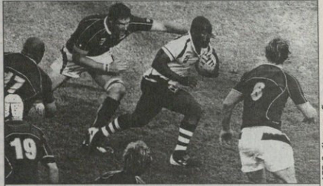
თბილისში ნამუფება მოსივ რაულენმა იფრიკელთა იფი ბეგრეფერ გაარტყა