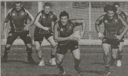
„შავებს“ სავა შავი არ ატყა

ფუნჯანდელი მსოფლიოს თასის გახსნილ მატჩში, რაც არაერთხელ სხვა საფრანგეთის მსოფლიოს რაუნდის გახსნულ ობ-ბ გვეხვევს მდებს ავრია და ასე ნალოვლები საფრანგეთის მისთვის შეუფერალი გარეგანი უკუდამოადი მოქმედება.