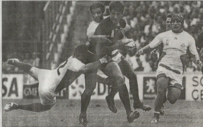
მილოდინე, მტერი ერთი ერთზე იყო თუ ერთი ათზე.

ხომ ასე უმარტივად წავეს „იდე-ლოგები“ გუშინ, მაგრამ იმის შეგ-რინება მინდა და არ გავტყუნიო, რომ ისინი არ იბრუნდნენ და მოე-დანზე ვალის მოსახდელად იყვნენ გასული. პირიქით — ზედინდის, გაიმძაფრეს, გორგობის, მანანდლის, ლაბაძის, შინინისა და ყველას ვერც ჩამოვიყვით, ამერიკა სუკეთესი მორაგბის არცერთსაც კი ომამში და-ჩაგრულებმა ბრძოლაში ბოლომდე არაფერი დაუმის მსოფლიოს ოსის მასპინძელსა და ერთ-ერთ უმ-თავრეს ფაქტორს, ვეროის უმ-ლოურეს გუნდს ზეიად მასურადის დღეობი დამარცხებული, მაგრამ უტეხი ქართული სულის ამოახი-ლი იყო და, ძალი იყოს თქვენი მკვდრისად — ქართული უკრა-იბის ფეხებიდან წამოსული, არცთუ მოკლე სარდაბი იღვითით ითარ ელოშვილმა მატჩის ბოლოსკენ თავით ისე ჩააგრო მტრებზე მინდო-რში, ნაიღი გახდა — ამ ბიჭების დამარცხება კი, მაგრამ დაიჭიბა არანაირად მოხერხდება ისინი იმ ქართველთა შიამოშობებით არიან, ბრძოლაში იმის უცოდინარდ რომ