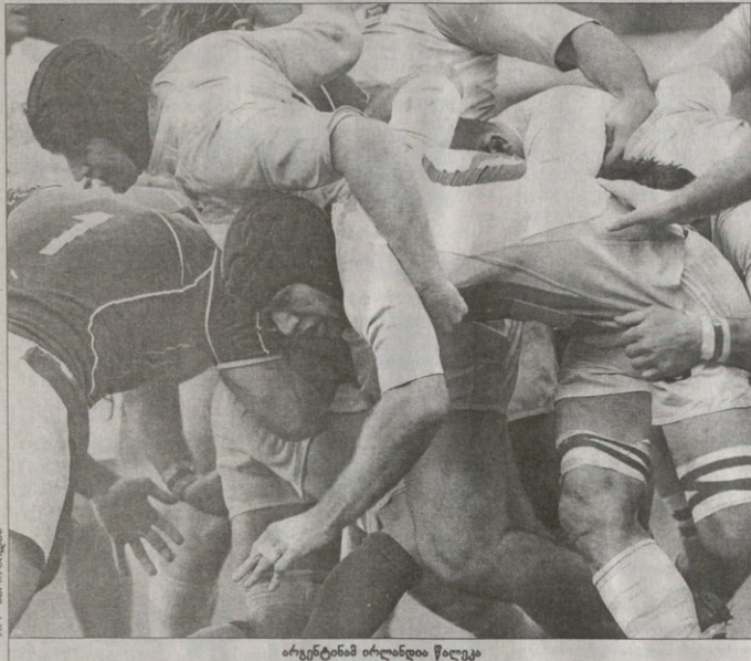
არგენტინა ირანდია წაღვა