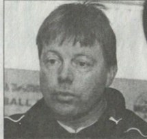
მთავრ ოქამირნიუც, მთავრ ოქამირნიუც

საქართველო 17-წლიანდელთა ნაკრებმა ბულგარული შესარჩევი ტრავსი მატჩები ვამირბევილი კი დაასრულია, მაგრამ მისთვის ელიტარულიის კარი უკვე დაქცევილი იყო. ბოლი მატჩში ქართველებმა მასხინებუხს 5:2 მოუქცა, თუქცე ამით რა ხეირი — მამანდელ ხირატისთან 0:4, ხოლო ურგერითან 0:1 წაქცევი.