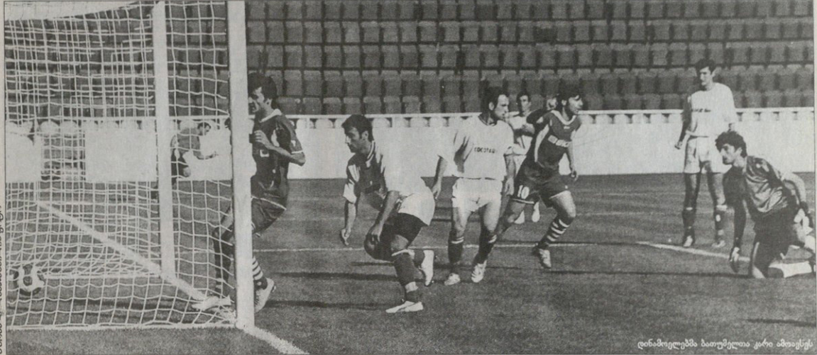
დინამოელებმა ბათუმელთა კარი ახიაესენ