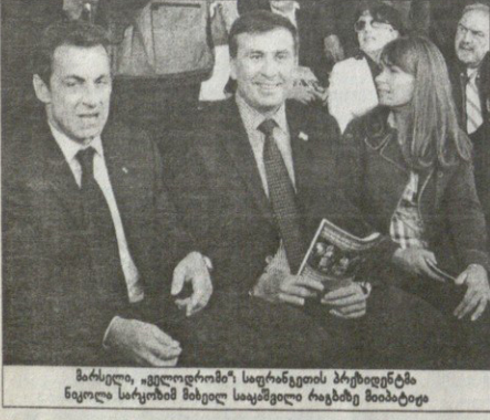
მარსელი, „ველოდრომიზე“ საფრანგეთის პრეზიდენტმა ნიკოლა სარკოზიმ მიხელო საყაშვილი რაგბიზე მიამატიტე

უტკობი დიდბუბუძე: მადლობა ბიჭებს, მადლობა მწერლობებს, მადლობა ყველას, ვინც ვერცხში გვედა და ვეკომპარტიდა ეს ალბათ ჩვენ ბოლო სანაკრებო მატჩი იყო და უბედურების კაცი ვარ, იცნება რომ აისრულდ მთელი მსოფლიო ქართული რაგბიზე ავაღაპარაკო.