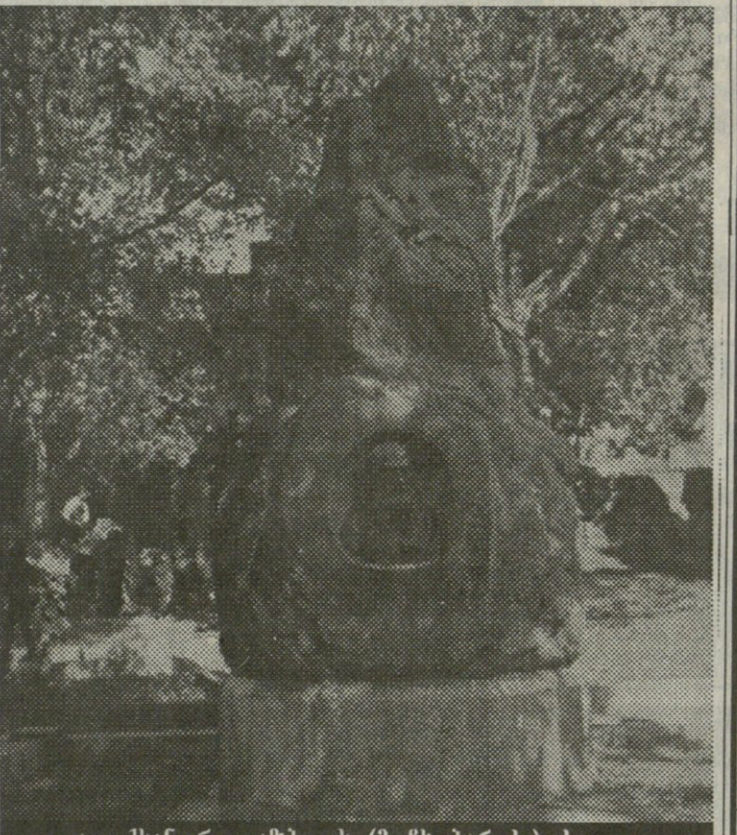
ალექსანდრე ყაზბეგის (მონუმენტის) ძეგლი