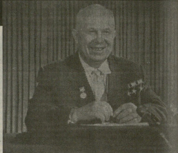
ყოველივე ამის უკან ინტრიგა იმალებოდა...