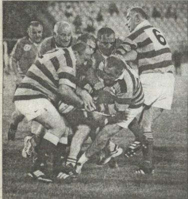
ბაქრი ძაიშილასის ფოტორეპორტაჟი

სრულიად საქართველოს კათალიკოს-პატრიარქს, უწმინდესსა და ურეტარესსა ილია მეორემ დალოცა და აკურთხა საფარზეთში მიმავალი „ბორჯღალოს გუნდი“. შემდეგ ჩვენი ნაკრები მიხედო მესხის სახელობის სტადიონს მთავდა, სადაც ჩვენი ბიჭების გაცხადების საღამო მიუწყო. თამაშებს ვეტრანმა მორაგბეებმა — ქუთაისელი და თბილისელი ჯარმაგი კაცები ნახევარი საათი შეერკინენ ერთმანეთს. იყო ძველი ქართული ზრდილი, ხმა-ნახვლების ტრიალი და ზღუნური ანსამბლების გამოსვლა. იმდერა ნაბ დასამბობს, ბოლოს კი ფიორეერეთი დასრულდა ეს ყოველივე ერთ რამზე დავწყვიტოდა გული: ხალხი იყო ცოტა არადა, „დელოები“ ნამდვილად იმსახურებენ დაფასებას და ქიმაების გვერდში დგომას.