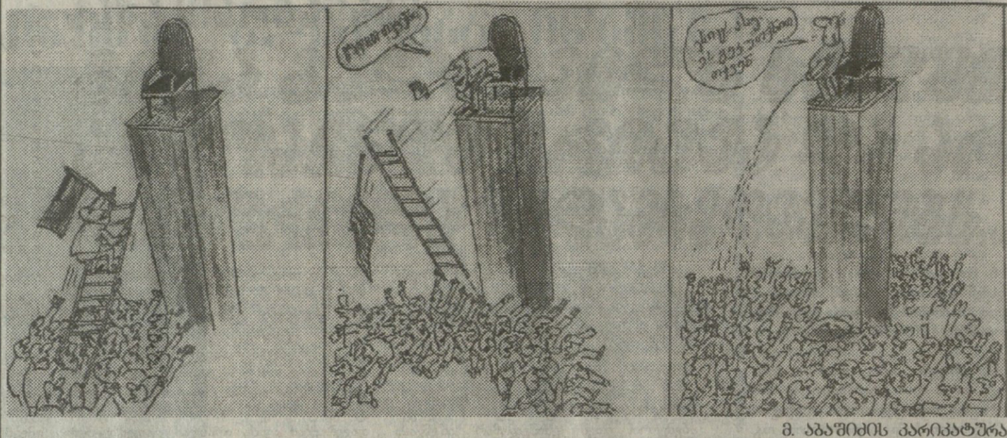
მ. აბაშიძის კარიკატურა

ედუარდ შევარდნაძე: „აფხაზეთის პრობლემის გადაწყვეტის გასაღები რუსეთის ხელშია. დღეს ბევრი რამაა დამოკიდებული მოსკოვის სამიტზე მიღებული გადაწყვეტილებების შესრულებაზე“