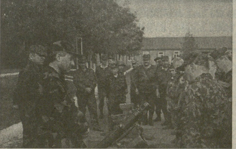
თმში წასვლა მას უხარის...