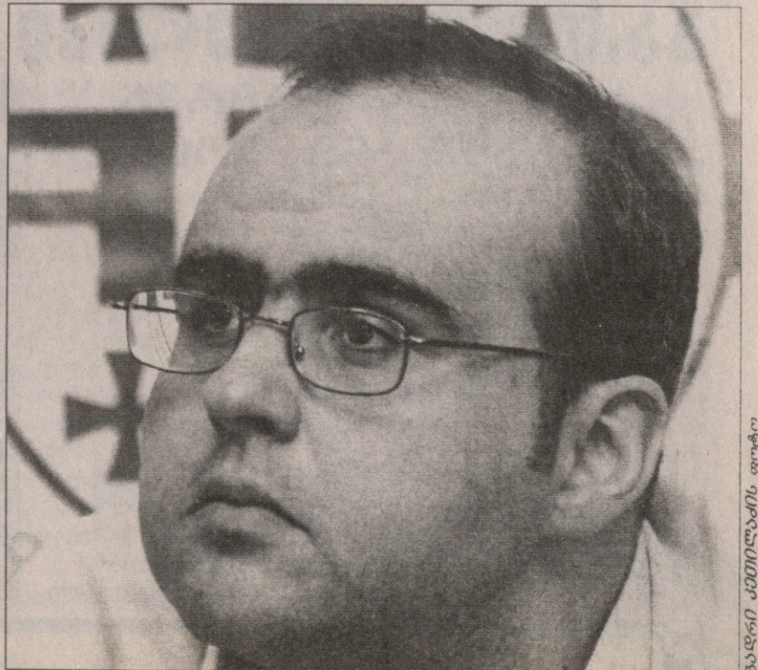
იხილეთ მესამე გვერდი