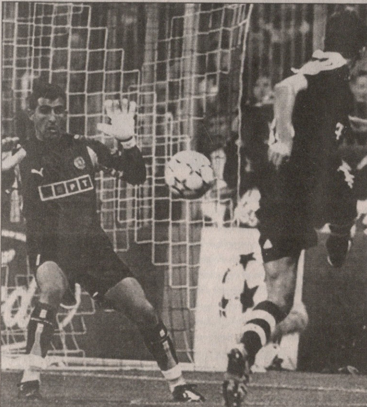
ბაიერნი — სპორტინგი. რომი მაკაიმ რიკარდუს ბურთი ვერ ააცილა

გაინავარდა და კრუზს სანაქებო პასი დაუგორა. არგენტინელმა ბურთს ოსტატურად მიპკრა და გაიტანა. ბუნებრივია, ასეთი თავგადასავალი მასპინძლებისთვის მძიმე გადასატანი უნდა ყოფილიყო და ამიტომაც ვერ გაიმართა წელში „სპარტაკი“ მე-20 წუთამდე, ხსენებულ დროს კი დენის ბოიარინცევმა რომან პავლიუჩენკოს პასი მიიღო და დაარტყა, მაგრამ მეკარე ფულიო სეზარს ვერ აჯობა. რამდენიმე წუთის შემდეგ „მე-ლურჯების“ გო-