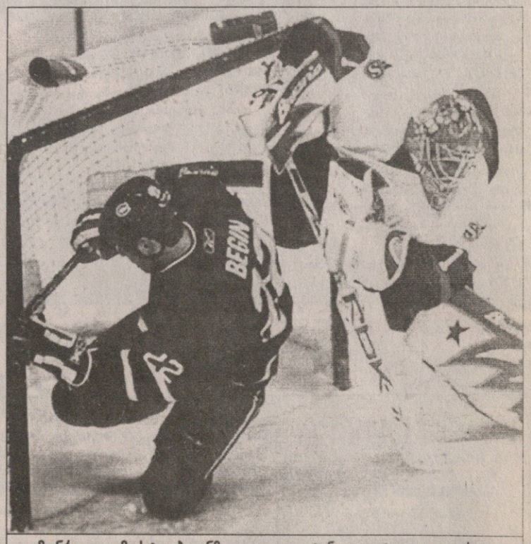
მონრეალელმა სტივ ბეგინმა გოლიც გაიტანა და ოტაველთა კარიც