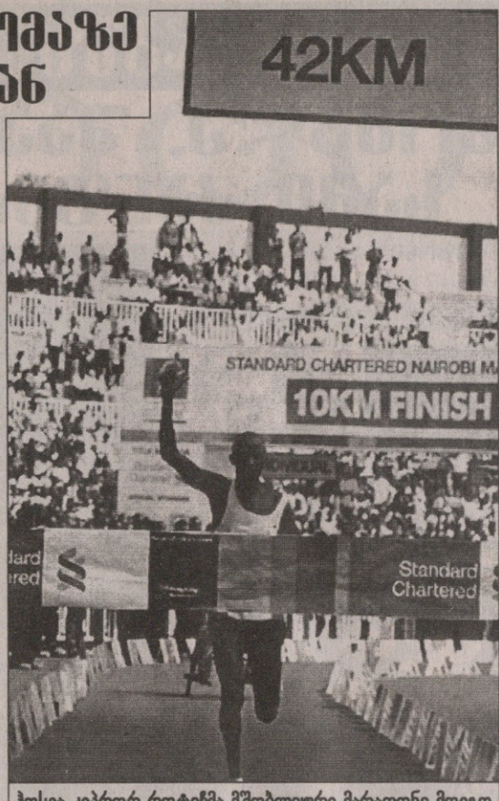
ჰოსეა კიპრორ როტიჩმა მშობლიური მარათონი მოიგო

თუ ნაირობიში კენიელმა კაცებმა მესამე ადგილი უგანდელ ალეკს მუნინგას დაუთმეს, ფრანკფურტში მთლიანად დაიპყრეს კვარცხლბეგი — ვილფრიდ კიგენმა ფინიშს პირველმა უწია 2 საათის 9 წუთისა და 6 წამის შემდეგ და მას უკან მოხვს არუსეი და ფრანსის ბოუენი მიჰყვნენ.