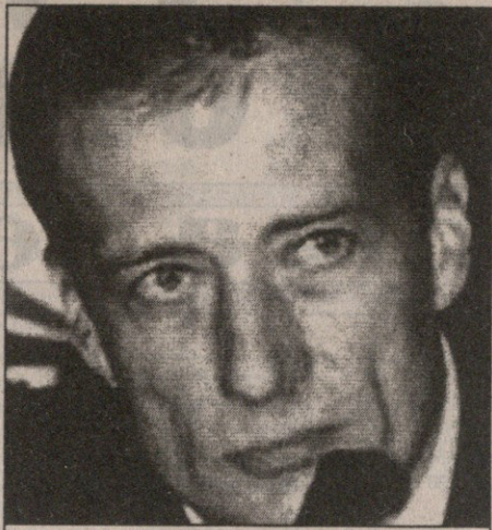
პეტერ ბოჟიკმა რეალური სურათი დახატა

აი, რა განაცხადა პეტერ ბოჟიკმა: „დანიშნვის დღიდან ვცდილობდი, რომ ხალხისთვის რეალური სურათი დამეხატა, მაგრამ ქვეყანაში ნაკრებზე და უნგრულ ფეხბურთზე რატომღაც დიდი წარმოდგენა აქვთ, სინამდვილეში კი ჩვენ ძალიან ჩამოვრჩით. ქომაგები და ფედერაცია ჩემგან არარეალურს ითხოვდნენ. ხალხს ჰგონია, რომ უნგრეთის ნაკრები არ იმსახურებს იმ ადგილს, რომელზეც ამჟამად იმყოფება, მე კი ვამტიკცებ, რომ ძლიერი ჩემპიონატისა და მაღალი კლასის ფეხბურთელების გარეშე ეროვნულ გუნდს მომავალი არ აქვს“.