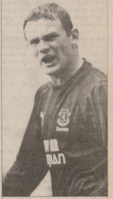
ათი მატჩია, რუნის გოლი არ გაუტანია