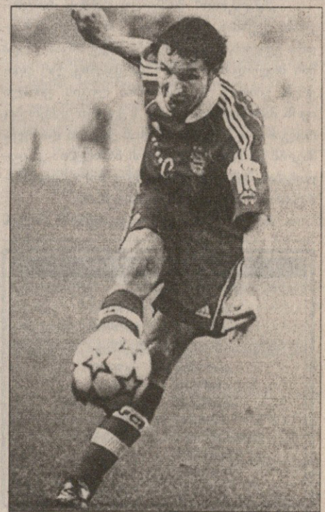
მარკ ვან ბომელი მეტოქეებს ებუქრება

„ჰანოვერის“ თავკაცმა დიტერ ჰეინგმა კი აღნიშნა: „ჩემმა გუნდმა ბოლო ხუთ მატჩში მხოლოდ ერთი წააგო და ეს ძალიან მაიმედებს. „ჰამბურგი“ ამჟამად მე-13 ადგილზეა, მაგრამ ყველამ ვიცით, რომ საკმაოდ ძლიერი შემადგენლობა ჰყავს და ზედა სა-მეულში ყოფნას იმსახურებს“.