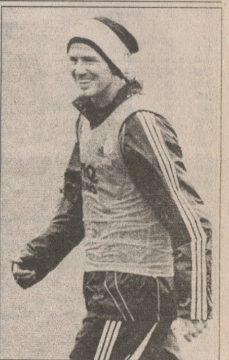
კაპელოსგან ათვალწუნებული ბექები დღეს ტრავმის გამო ვერ ითამაშებს

„ვალენსია“ კვირას საომრად სანტანდერში მიდის. „ლამურათა“ მწვრთნელ კიკე ფლორესს გუნდის ნახევარდაცვაში ცვლილებების განხორციელება მოუწევს. „ვალენსიას“