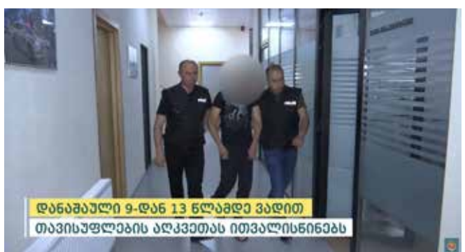
დანაშაული 9-დან 13 წლამდე ვადით თავისუფლების აღკვეთას ითვალისწინებს