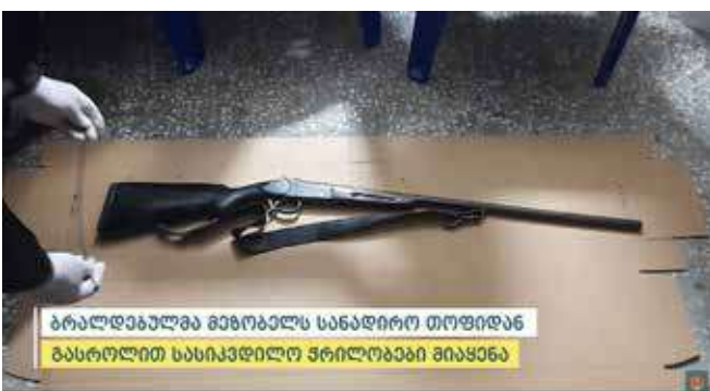
ბრალდებულმა მკვლავლს სანადირო თოფიდან გასროლით სასიკვდილო ჭრილობები მიაყენა

განზრახ მკვლელობის ფაქტზე გამოძიება საქართველოს სისხლის სამართლის კოდექსის 108-ე მუხლით მიმდინარეობს.