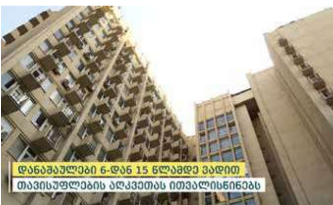
დანაშაულები 6-დან 15 წლამდე ვადით თავისუფლების აღკვეთას ითვალისწინებს

განზრახ მკვლელობის, ჯგუფური ძალადობის ორგანიზების, განსაკუთრებით მძიმე დანაშაულის დაფარვის და განსაკუთრებით მძიმე დანაშაულის შეუტყობინებლობის ფაქტებზე გამოძიება მიმდინარეობს საქართველოს სისხლის სამართლის კოდექსის 108-ე, 225-ე, 375-ე და 376-ე მუხლებით.