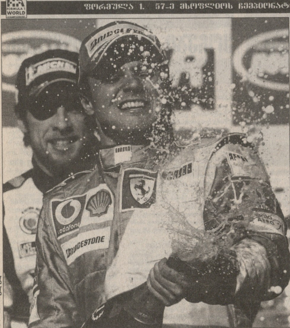
ფელპე მასა პირველი მსოფლიო დიდი პრიზი მოიგო