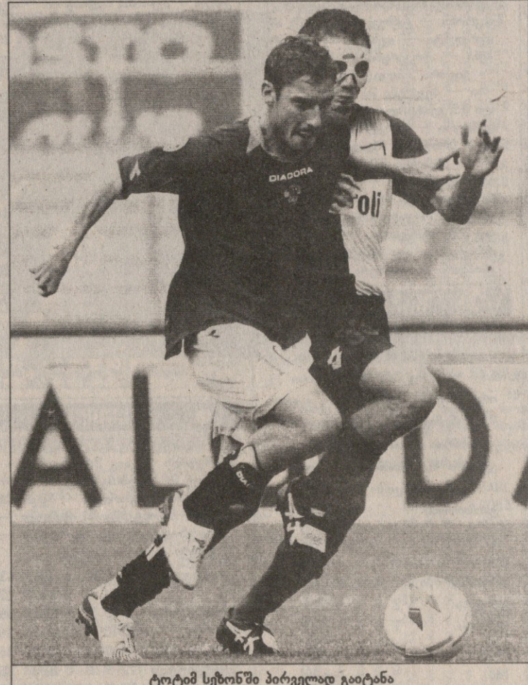
ტოტიმ სეზონში პირველად გაიტანა

ტურინის ცენტრალური მატჩი „უდინეზას“ და „ინტერს“ შორის უდიდესი გამოდგა. ორივე გუნდი ზედმეტად ფრთხილობდა და რეალური საგოლე მომენტი არც შექმნილა. ტერიტორიულ უპირატესობას „ინტერსს“ ფლობდა და ალგა-ალგა მწვავედაც უტევედა ზოლში, მაგრამ ფრე ლოგიკური შედეგი გახლდათ. მეორე ტაიმი პირველთან შედარებით გახსნილი გამოდგა. ლუიჯი ფიგუს ორ სახიფათო დარტყმულს მასპინძელთა მცველი აღუდგა წინ, ხოლო ზლატან იბრაჰიმოვიჩის ორჯერ მორგან დე სანკტისმა აულორობერტო მანინიმ ერნან კრესპო ხულიო რიკარდო კრუზით, ხოლო იბრაჰიმოვიჩი ალვარო რეკობათი შეცვალა, მაგრამ ამას შედეგი არ მოჰყვა. უდინელთა რიგებში კი ყველაზე აქტიური ვინჩენცო იაკინტა გახლდათ. პირველ ადგილზე გადასვლის შანსი დაკარგა „რომაში“. „კიევის“ მწ-