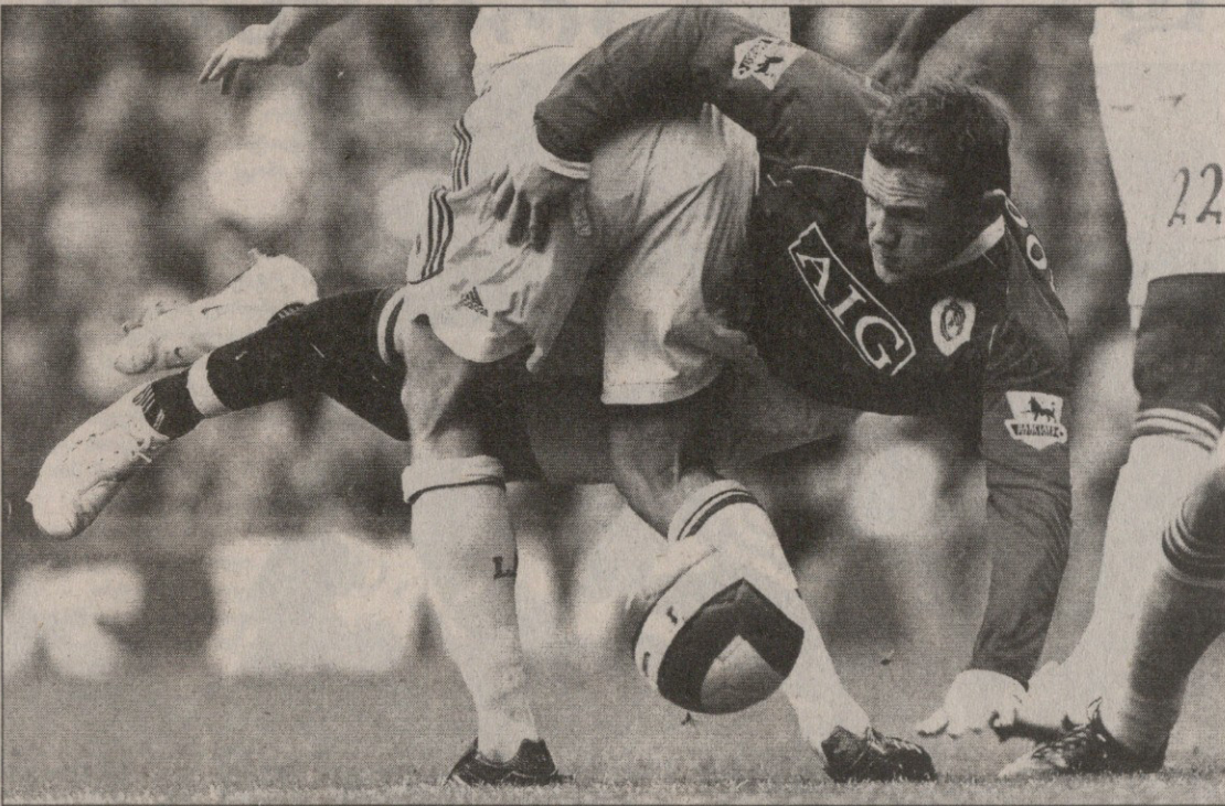
სად არ გაძვრება ბურთისთვის რუნე