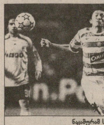
ნაკამურამ სტრანჩანი გააოცა

„სელტიკი“ ამჟამად დანარჩენებზე ერთი თავით მაღლა რომ დგას, ამ უქმეებზე კიდევ უფრო ნათლად გამოჩნდა გორდონ სტრანჩანის გუ-