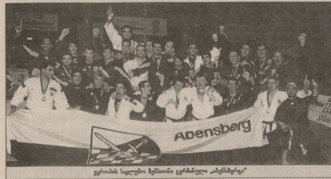
ევროპის საკლუბო ჩემპიონი გერმანული „აბენსბერგი“