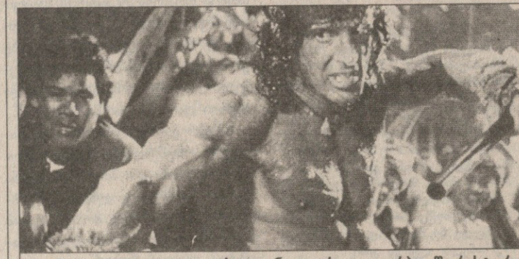
სტალინი და ირლი ლივრბაულში რესტორანს გახსნიან