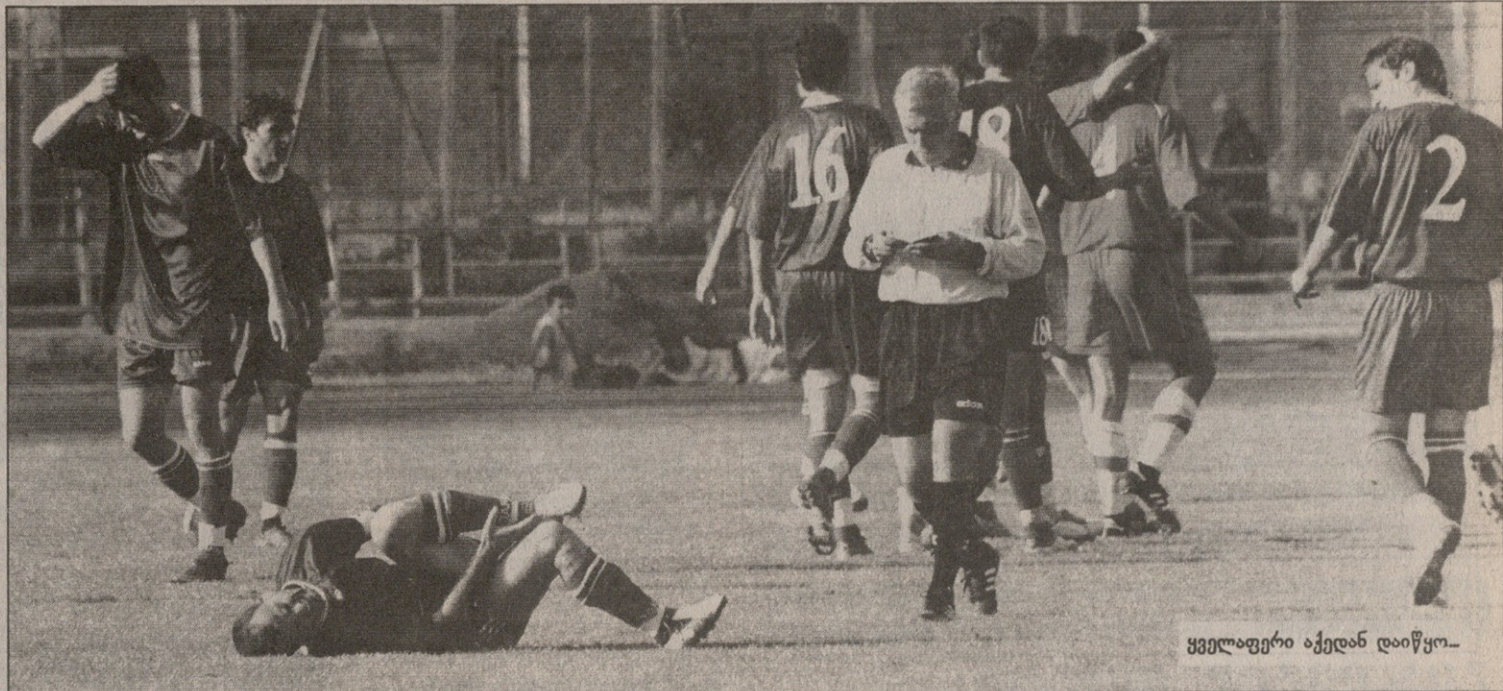
ყველაფერი აქედან დაიწყო...