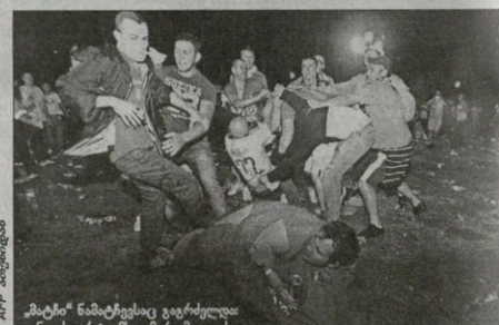
მიტჩი ნაბიტისაც გიგრულდა: ვინ დის უტყვას, დუნთობა იქის სპეტონების პოლიციამ კი 128 ხულიანი დააკვა