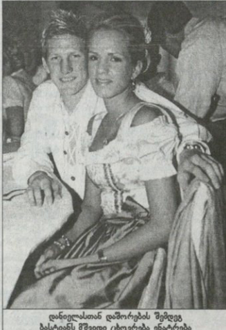
დანიელასთან დანიის შემდეგ ბასტანას მშვიდი ცხოვრება ინატრება

„ის ტაქსი სახლამდე კარგა ხნით ადრე შეამწინა. თავიდან მორიგი, თავის გზაზე მიმავლი მანქანა ვერა — ასეთები ხომ ქალაქში უამრავია — მაგრამ მერე შეამწინა, რომ სულელა სათიჯ მან შეუხვია, იქით შეუხვია ტაქსივაც. შეუქონებზე მის სახალსეზე დგებოდა, სინქარეს მხის სინქარის მიხედვით ცვლიდა. თითქმის სახლთან მისულს სხვა გზა არ ჰქონდა — ბოლოს და ბოლოს, სხვიან გაეკვიცა — სულა შეანელა და გაჩერდა. გაჩერდა ტაქსივაც აქედან სახლამდე 50 მეტრშია ჩრებოდა. ის დაძაბული იყურებოდა სარკეში, გულისცემა გაუმორბოდა.“ ამის შედეგად რაც მოხდა, თავად ასე იფიქრებს: „უცნაურ ტაქსის კარი გაიღო. ხელი შიშმა დანარია. მზელოდა, სინებულეში კი არასდროს იყო, რა მოხდება სანამ ფიფურას გაეჩრდილო, გული თითქმის გამბერდა კიდევ“. მაგრამ, მოხერხების „ბაიერინის“ და გერმანიის ნაერების ვარსკვლავი ბასტანა შეამწინაფიქრე გადარია, ტაქსიდან ქერა, დიდმკერდა ქალი გაემოღოდა და მისკენ გაემოღა. უკვე ყველაფერი ნათელი იყო — მორიგი თავყვანისმსებელი, რომელიც თითხში შენთან ერთად შემოიბრძოდა ცდილობს. — შეიპატრეთ ის ქალბატონი მინ? — ჰკითხეს ბასტანას ურწმუნობით. — არა — მთელი მან და, ალაბო, გულწრფელიც იყო. მსოფლიოს მარმანდელი ჩემპიონატის შემდეგ მისი და სხვა ფეხბურთელების პოპულარობა ყოველგვარ საზღვარს გადასცდა. ქალები კი — საერთოდ, გვეკვირბებოთ, შეამწინაფიქრე კარგა ხნის