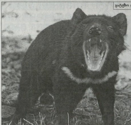
გატუზო და გატუზო