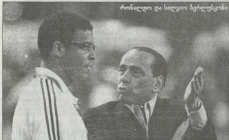
რონალდო და სილვიო ბერტუსკინი