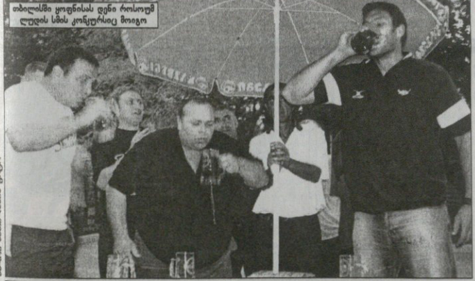
თბილისში ყოფინას დენი როსოუსმ ლუდის სმის კონკურსიც მოელო

— ფრელი სამხრეთაფრიკული გამომდგა აქამდე ავსტრალიური და ახალ ზელანდიური კლუბები ბატონობდნენ. წლებს რა მოხდა?