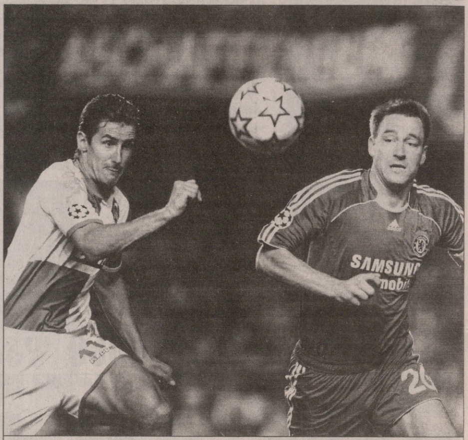
მიროსლავ კლოზე (მარცხნივ) ტრავმიანიც ითამაშებს