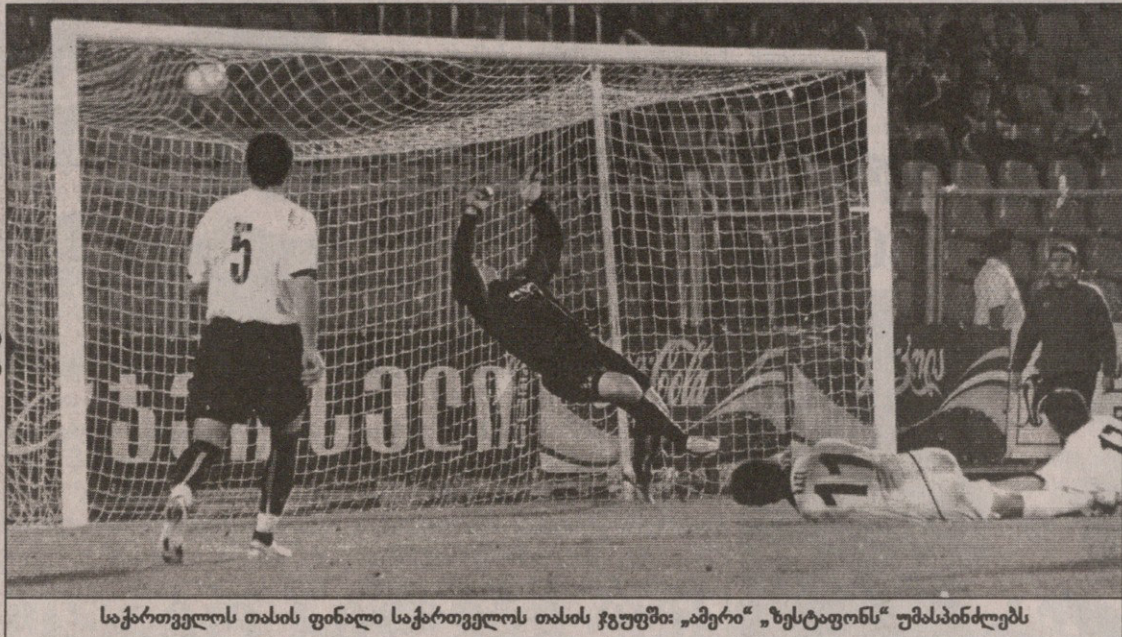
საქართველოს თასის ფინალი საქართველოს თასის ჯგუფში: „ამერი“ „ზესტაფონს“ უმასპინძლებს