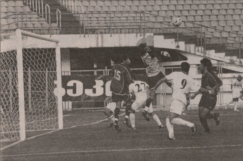
ასეთი მომენტები „ნორჩი დინამოს“ კართან ხშირი იყო