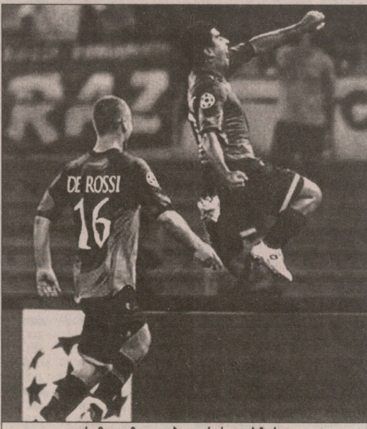
რომაელი მეგობრები: დე როსი და პიზარო