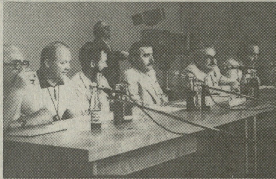
მრავალსმეტყველი დოკუმენტი, ზოგის "შავი" პირი, ზოგის - ორგინალი ხელთა მქვეს.

მართვის აპარატში მრავალი წლის მუშაობის მანძილზე ერთი თვისება წესად დამჩემდა - სამსახურებრივ დანიშნულების ქალაქის პაწია ნაგლეჯსაც კი უშად არ გადავავლებ. ასე გროვდება, დროთა განმავლობაში, პირადი არქივი, თანდათანობით დაწმენდილი, დახარისხებული, მდიდარი... ბევრი მაშინდელი საინტერესო და