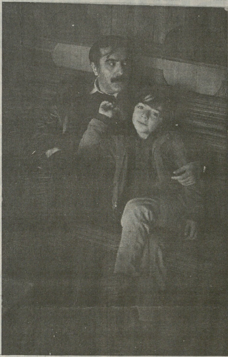
გონიერებად და ამ კითხვებს მწარე პასუხებიც მოჰყვება გაგრძელებებით, ოღონდ ოპონენტებისა... და ამის შემდეგ ვინმეს პირში ენა როგორ უტრიალდება „სასაყვედურად“, რომ მე წამოვიწყე ეს დისკუსია?..

- სწორს ბრძანებთ! - კეთილი და პატიოსანი. ახლა მიუებრუნდეთ მორიგ კითხვას - 8 აპრილს თბილისში ვითომდა შეგარდნადის ჩამოფრინის შესახებ. ინფორმაციის წყაროდ თქვენს კითხვაში მითითებულია გენერალ ლებელიძის წიგნი. იქით მაქვს თქვენთან შეკითხვა: ხომ ვერ დამისახელებთ რომელ წიგნში, რომელ გვერდზე წერს ამას ლებელიძე? პირადად თქვენ თუ გაქვთ წაკითხული ლებელიძის წიგნი ეს „მტკიცება“?