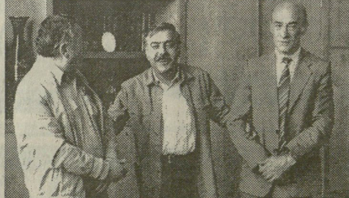
გაგრძელება მე-6 გვ

სახელმწიფოს უმაღლესი ეშველიის ერთ-ერთი ხელმძღვანელი, ყოფილი პრემიერ-მინისტრი ბატონი თსოკუა: „დეალიზაციის ეროვნული ბანკის პრეზიდენტად 1992 წლის ოქტომბერში დაინიშნა იმ პერიოდში ეროვნული ბანკი უკვე ახლადარჩეული პარლამენტის და სახელმწიფოს მეთაურის დაქვემდებარებაში გადავიდა დეალიზაციის დანიშნის დღიდანვე ეროვნულმა ბანკმა უზომოდ დიდი სესხების გაცემა დაიწყო. იგი მეორე დღესვე გამოვიდა პარლამენტის სხდომაზე და განაცხადა რომ ლიბერალური ფულად-საკრედიტო პოლიტიკის მოშორე იყო და მას ედუარდ შეგარდნამე უტყობდა მხარის ა პერიოდისათვის ეროვნული ბანკისათვის დაწესებული ღმისა 140,0 მლნ 326,0 მლნ მიადწია ეს კატასტროფა იყო, რადგან ეროვნული ბანკი მთავრობას არ ემორჩილებოდა ჩვენ მათ საქმიანობაში ჩარევის არანაირი უფლება არ გქონდა 1993 წლის მარტში შემოდის პირველი ინფორმაცია მინისტრთა კაბინეტში შს სამინისტრიდან, რომ ბანკში ცუდი ამბები ხდება. ამ საკითხის შესასწავლად მაშინვე ვნიშნავ სამთავრობო კომისიას და თქვენი, რომ იქ მართლაც საშინელებები ხდება სამთავრობო კომისია ადასტურებს, რომ ეს კომისიის დაღუპვა ამის შემდეგ მივიღეთ ედუარდ შეგარდნამესთან