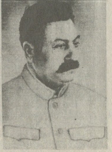
მს არ არის სტალინი, მს მამულაშვილია