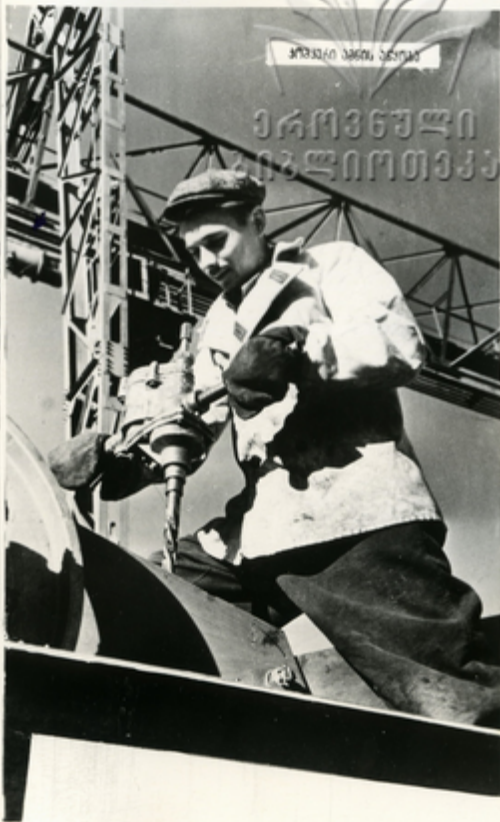
მთავარი მანქანის პარკი

კონსტრუქციისათვის საღებავს ახალი მანქანები ემთხვევა კონსტრუქციის მანქანებზე დაახლოებით. ამჟამად დაახლოებით მოწყობილია „კონს-5—5.5“ მოდელის ტიპის მანქანები და სხვადასხვა სახის მანქანები, რომლებიც უზრუნველყოფს და მათი მოდელის მთავარი მანქანის საღებავს დაეხმოს.