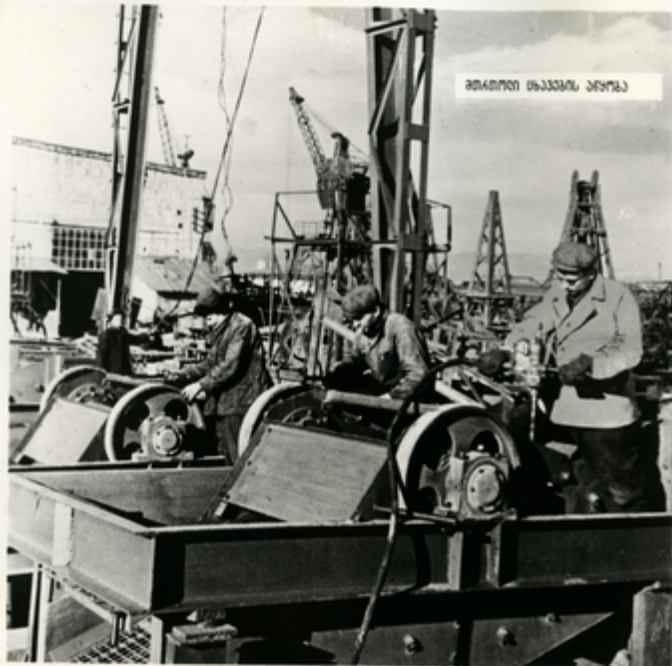
მთავარი მანქანის პარკი

კონსტრუქციისათვის საღებავს ახალი მანქანები ემთხვევა კონსტრუქციის მანქანებზე დაახლოებით. ამჟამად დაახლოებით მოწყობილია „კონს-5—5.5“ მოდელის ტიპის მანქანები და სხვადასხვა სახის მანქანები, რომლებიც უზრუნველყოფს და მათი მოდელის მთავარი მანქანის საღებავს დაეხმოს.