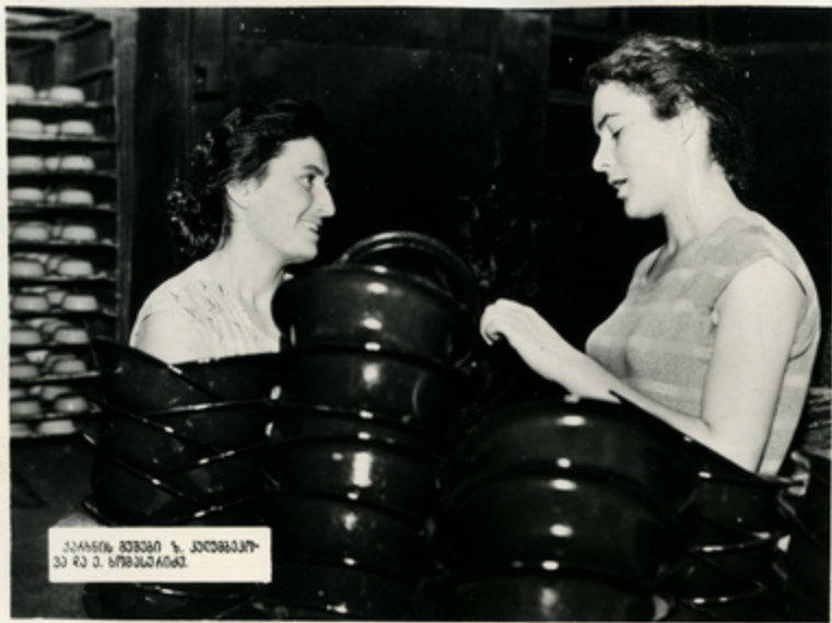
ՀԱՅԿԵՆ ԲՈՒՅՈՒՆ Ի. ԿՈՆՑԵՆՏՐԱՆ ՆԱ ԸՆ Ծ. ԵՐԵՎԱՆԻՈՎՈՑ

ՄԻՈՒՆԻՍՆ ԶԱՆՈՊՅԱՍՈՒՆՏԻՄԱՆ ԸՆԿՈՎՈՒՄԻՆ ՁՅՅԵՄԻՏԱՐ ԶՈՒՆԱՐԸՆ ԹՄԵՆՄՅՆԱ ԶԱՆԻՆ ՄԱԿՈՅՆԱ ԸՆ ՏՅԱՐՆԱՄԱՌՈՒՄԻՆ, ՎՅ ԹՄԵՄՄԱՌԻՄՈՒՄԻՆ ԶԱՅՄՆԱՅՅՎԱ- ԶԱՐ ՆՅՍՈՒՆԱՐՈՒՄԻՆՈՎՈՐՈՎ ՄԱԿՆԱՆ «ԶԱՆԱՅԱԿԱՑՈՒ».