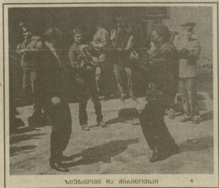
ზიუგანოვი და შირინოვსკი