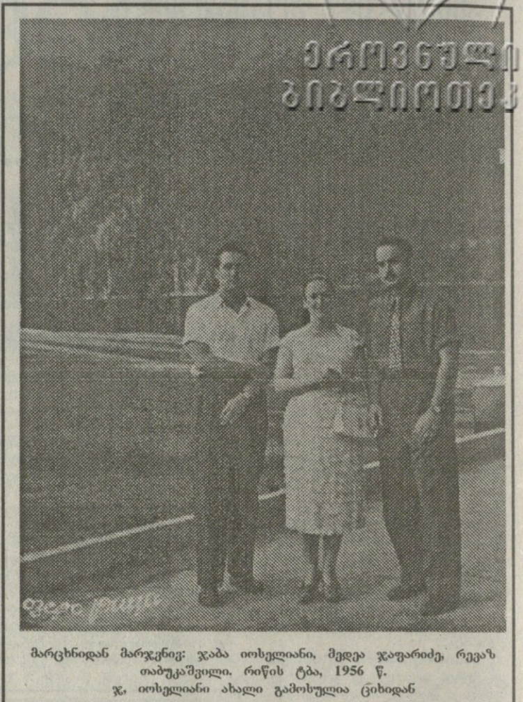
მარცხნიდან მარჯვნივ: ჯაბა იოსელიანი, მადეა ჯაფარიძე, რევაზ თაბუკაშვილი. რიწის ტბა, 1956 წ. ჯ. იოსელიანი ახალი გამოშლილი ციხიდან

გვეწამებდნენ. მუქარის ტონითაც კი გვეუბნებოდნენ „ოპოზიცია ციხეში უნდა იჯდესო“. სამწუხაროდ, ცხოვრებამ ჩვენი პოლიტიკური უცილობა კი არა, ცოტა სხვა რამ დაამტკიცა. ვერც დსთ-ში შესვლამ, ვერც ბაზების დათმობამ და სხვა ხელშეკრულებებმა აფხაზეთის დაბრუნების საქმეში ნაბიჯითაც წინ ვერ წაგვწია. პირიქით, ხელისუფლების თხოვნით მოყვანილი ე.წ. სამშვიდობო ჯარები, საქართველოს საზღვარს ენგურზე „საიმედოდ“ აფიქსირებენ. — ზომ ვერ ახსნი, რატომ დანიშნა ჯაბა იოსელიანი ჟენევის მოლაპარაკებების ხელმძღვანელად? — ვფიქრობ, მაშინ ის იყო ერთადერთი პიროვნება, ვინც ოპოზიციის შეტევებს ამ წამებთან ხელშეკრულების გამო თავის თავზე აიღებდა და მოიგერიებდა. საერთოდ კი, ჯაბა იოსელიანი ნებისმიერი პოლიტიკოსისათვის იმის მაგალითია, რომ ხელისუფლება პირადი მიზნისთვის კი არ გამოიყენოს, არამედ საშუალება უნდა იყოს ეროვნული ინტერესების სამსახურისთვის. თორემ, როგორც იტყვიან, — დრონი მეფობენ და არა მეფენი.