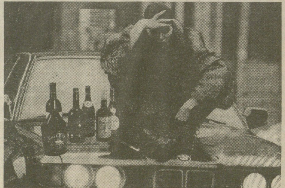
გაგრძელება შემდეგ ნომერში