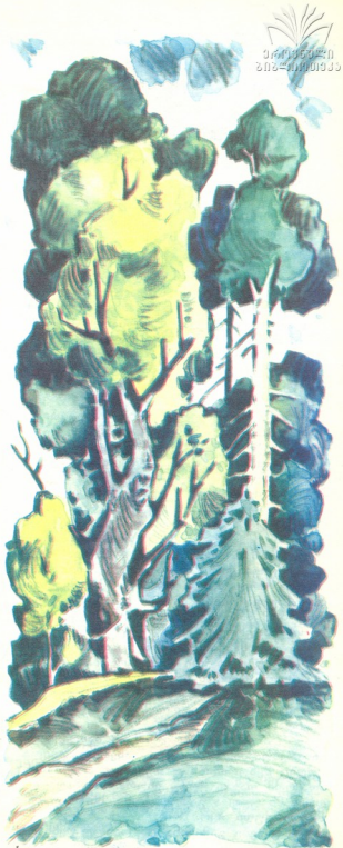
მზატვარი ბიოგამ რეინივილი

ტყეს, ისევე როგორც მთელ ბუნებას, დაცვა უნდა. და თითოეულ ჩვენგანს შეუძლია, ის კი არა, ვალდებულია თავისი წვლილი შეიტანოს ამ კეთილმოპილურ საქმეში. მაგრამ ბუნება რომ დავიცვათ, საჭიროა ვიცოდეთ, კერძოდ რა დავიცვათ. განა შეიძლება დავიცვათ მთელი ბუნება ერთბაშად? ჩვენ შეგვიძლია მზრუნველად მოვეკიდოთ, დავეხმაროთ მის ცალკეულ ნარმომადგენელს. საჭიროა ხედავდეთ, აფასებდეთ თქვენს გარშემო არსებულ ყოველ წერილმანს — ბალახს, ტიალუას, ყვავილს, ნერგს, რომლებსაც ზოგჯერ უფიქრლად თელავთ, სპობთ, ანადგურებთ. იცოდეთ, უმითოდ არ არსებობს არც ტყე, არც მდელო. ეს ბუნებაა.