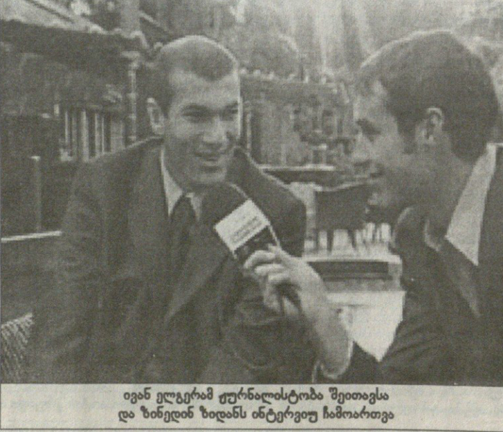
ივან ელგერამ ჟურნალისტობა შეითავსა და ზინედინ ზიდანს ინტერვიუ ჩამოართვა

ზიდანისთვის ინტერვიუს მიცემა უცხო საქმე არ არის. ის ვარსკვლავია და, ბუნებრივია, კორესპონდენტების წინაშე ხშირად უნევს ჯდომს. იგივე მოხდა 28 ნოემბერსაც: „რეალმადრიდ TV“-მ მასურებელს მსოფლიოსა და ევროპის ჩემპიონთან