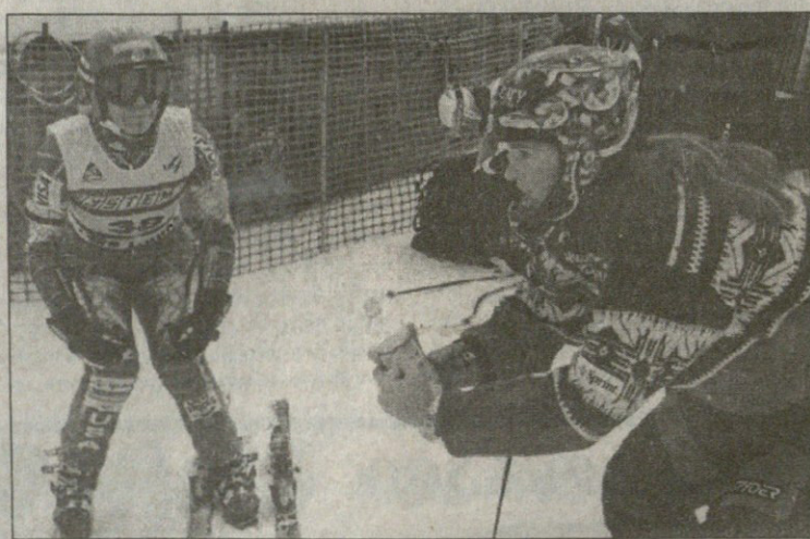
ლეიკ ლუისიდან

ის ამბავი აშშ-ის ქალაქ ლეიკ ლუისში ხდება, სადაც მსოფლიო თასის ეტაპი უნდა გაიმართოს. ამერიკელი სამთო მოთხილამურე გოგოები, პიკაბო სტრიტი და კეტლინ მონაჰანი ვარჯიშობენ, თან რაღაცნაირად: სტრიტი ხელში ბოთლით მოსრიალეებს, მონაჰანი კი მუხლებში მოხრილია.