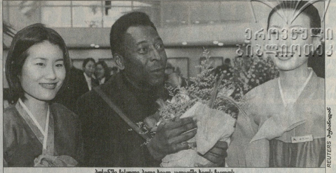
ჟესანში ჩასული პელებ გელ კალათში ხელს ჩაყოფს