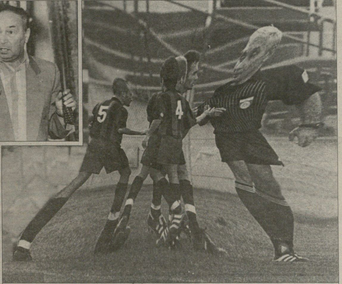
ქართული ფეხბურთის მრუდე სახე