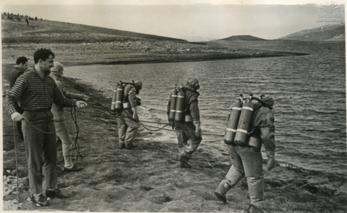
ამ დღეებში თბილისის ზღვის ნავიგა ბაზაი მყვინთავია. ისინი ინჰატმებრიან კვალუიკასიის მისალაბაღ. სუკათუზა: მყვინთავები შერიან ზღვაში.