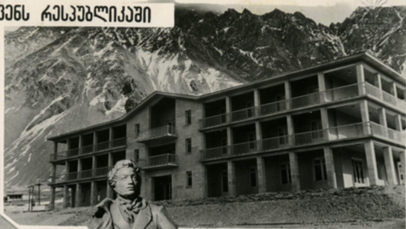
ახალი სკოლა ჩვენს რესპუბლიკაში.

ნდითი დღობით იზარება და კეთილმუნყოფილი ხდება მაღალი მთის რაიონული მენეჯერი-ყაზაგები. ამას ნინათ ამ სავსკლოვაციოთ გარეშე ახალი სასკოლო. მენეჯის ნათელი მენეჯე უკავი მენეჯიარე ახამება მთის პეიზაჟს.