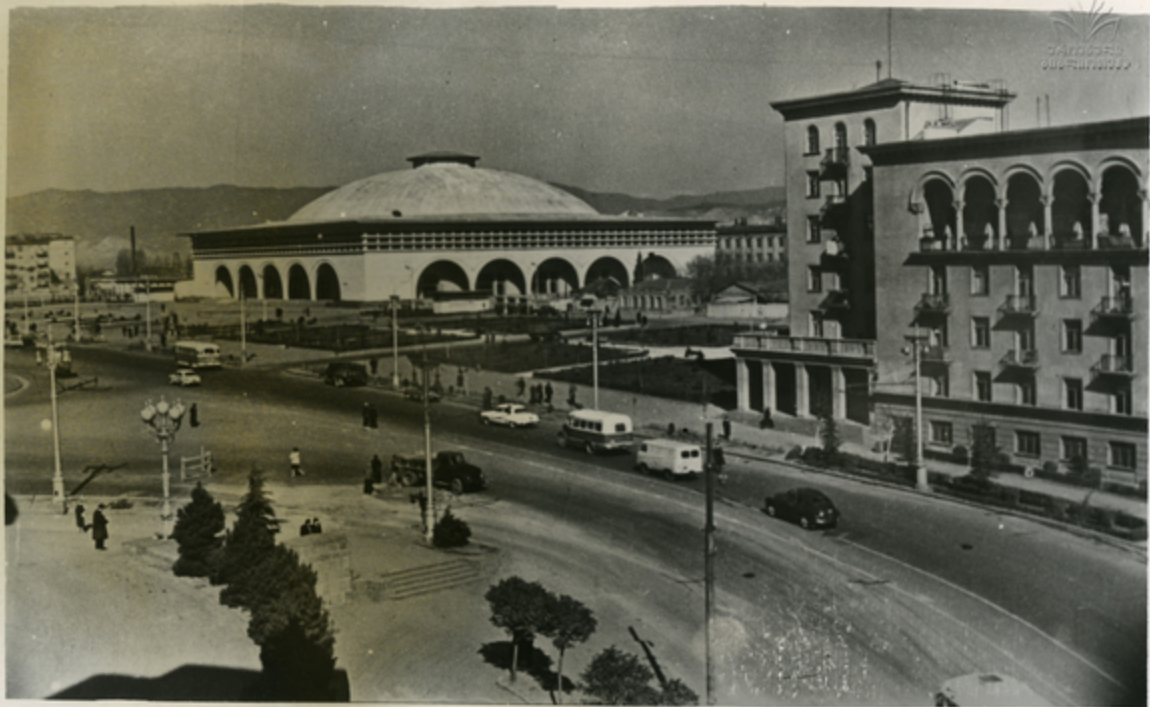
თბილისი ღვ. სპირიტის სახლის ნიშა მოქალაქე.