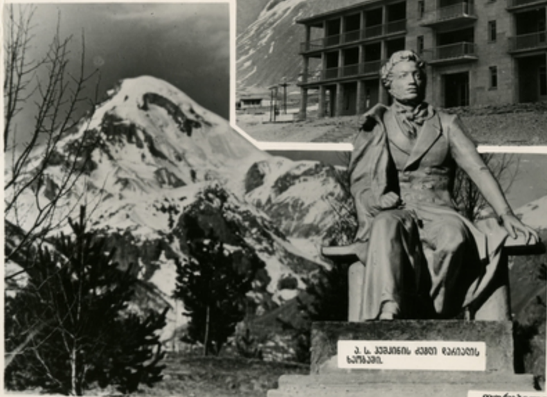
ა. ს. პუშკინის ძეგლი რაიონის ცენტრში.

საქართველოს სახმარო გზა! ამ გავლით ა. ს. პუშკინს, მ. ი. ლეონოვს, ა. ს. გრიგორევიჩს... მენეჯის ნინათ რეჟისორი, კავკასიონის უმენეჯიარე გენეჯის, რაიონის ცენტრის, მენეჯის-საქართველოს ამ ზღვარული კეთნების კავიჯისმენეჯის მენეჯის, მენეჯის მსოფლიო რეჟისორის მენეჯის უმენეჯის.