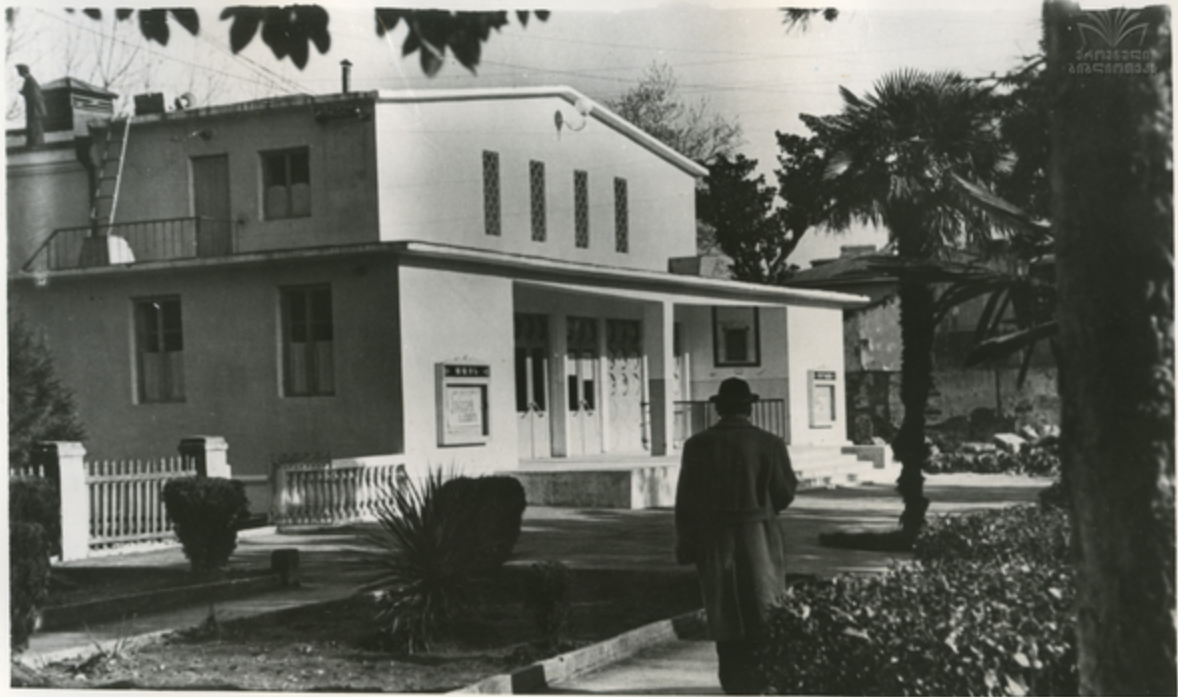
აგაპოს ჩაიწოდ სენსაკვი ბინისნა ახალი 450-აღმნილიანი ჴაათოუაკანიანი კინოთაჴსკი. საკათზა: ახალი ჴაათოუაკანიანი კინოთაჴსკი აგაჴაჴი.