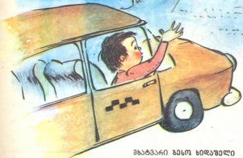
მხატვარი ბისო ხიდაშელი