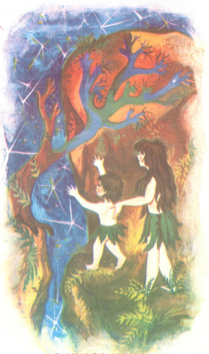
მხატვარი ნანა სულემიანაშვილი