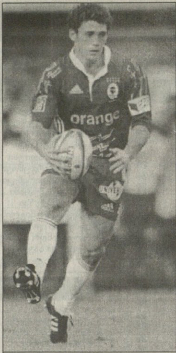
ასტარ ფრანსეს ნიკოლა რაფო თბილისში ითამაშებს

მოგახსენებთ, 11 ნოემბერს თბილისში სარაგბო მატჩი უნდა გაიმართოს. ეროვნულ სტადიონზე საქართველოს ეროვნული ნაკრები საფრანგეთის „ა“ ნაკრებს გაეჯიბრება.