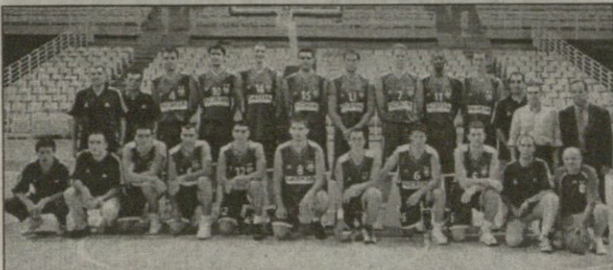
ათენის „პანათინაიკოსი“ ევროლიგის ერთ-ერთი ფავორიტი