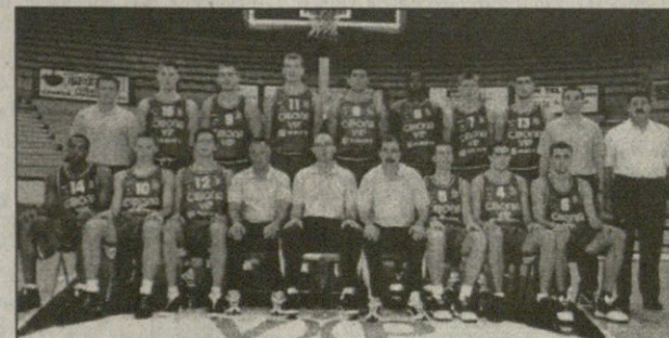
ზაგრების „ციბონა“ წინასაევროლიგო ტურნირი მოიგო