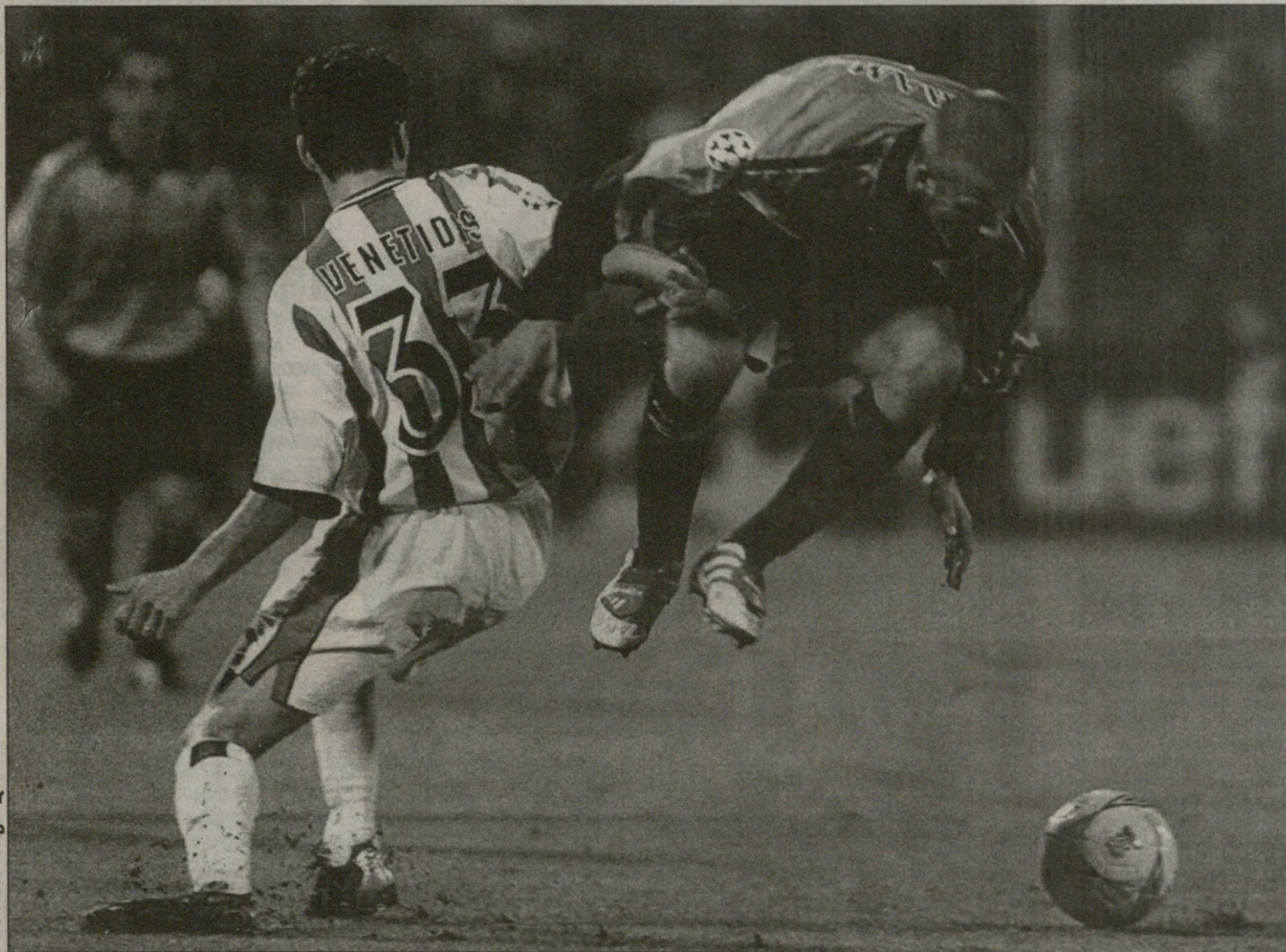
ოლიმპიკოსი — მანჩესტერი 0:2; ბერძენი სტილიანოს ვენეტისი (№33) და ინგლისელთა დამწინაურებელი დევიდ ბექემი

ჩემპიონთა ლიგაში ჯარგა ხანია სამი ტური მიიღია, მაგრამ რვავე ჯგუფის ცხრილმა პირველი წრის შემდეგ სრულყოფილი სახე გუშინ მიიღო. მოგეხსენებათ, უფამ ამერიკული ტრანსკონტინენტის გამო 12 სექტემბრის მატჩები გადადო და ორიოდ დღეში მათი თვის თავზე გამართვა ბრძანა. პირველი ტურის გამოტოვებული ნახევარიც გუშინ ჩატარდა. F და G ჯგუფებში ესპანურ-ფრანგული კლუბების მეტოქეობა ესპანელთა სასარგებლოდ დასრულდა: „ბარსელონამ“ კლუბიერის და რივალდოს გოლებით შინ „ლიონს“ სძლია, „დეპორტივო“ კი სტუმრად „ლიონს“ დაუხვდა. სტუმრადვე, „ოლიმპიაკოსთან“ ბექემის და კოულის გატანილით ბერძენებზე „არსენალის“ ჯავრი იყარა „მანჩესტერმა“. „პორტუ“ — „იუვენტუსი“ და „ფეიენოორდი“ — „ბაიერნი“ თითო ქულას დასჯერდნენ, განსხვავებით „სელტიკისგან“ და „სპარტასგან“, რომლებმაც შინ შესაბამისად „რუსენბორგი“ 1:0 და „სპარტაკი“ 2:0 დაამარცხეს. გერმანულმა „ლევერკუზენმა“, რომელიც თურქთა ებრაელ შიმ რევივოს ადრეული გოლით ნახევარ საათს აგებდა, ჯერ ანგარიში გაათანაბრა, მერე რიცხობრივი უპირატესობა მოიპოვა და საბოლოოდ 2:1 გაიმარჯვა. ასე რომ, ახლა ლიგაში უდნაჯარგო სამი გუნდილია: „ლევერკუზენი“, მადრიდის „რეალი“ და ათენის „პანათინაიკოსი“.