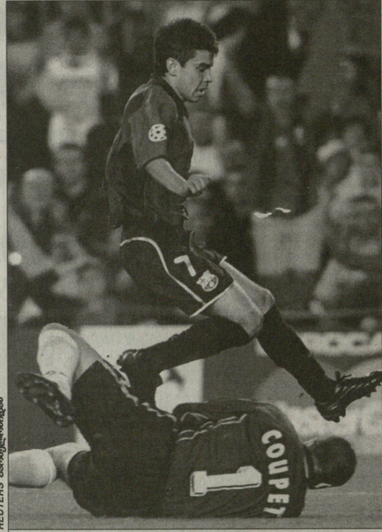
ბარსელონა — ლიონი. ესპანელი არგენტინელი ახალწვეული ხავერდოვანი და ფრანგი ფრანგი ფრანგი კუბე

XXXI ტური ბარსელონა 2:1 მარსი ბარსელონა 2:1 მარსი ბარსელონა 2:1 მარსი ბარსელონა 2:1 მარსი