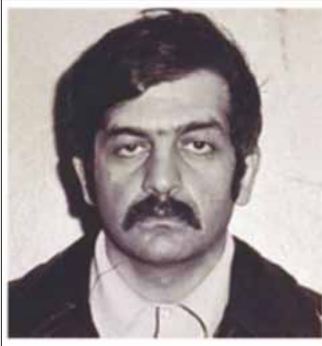
ზვიად გამსახურდია ZVIAD GAMSAKHURDIA