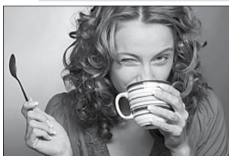
ანიჭებს უპირატესობას (33%), რძიან ყავას — 25%, დანარჩენები კი მწვანე ან შავ ჩაის, კაკაოს, ან უბრალოდ წყალს მიირთმევენ.

ამერიკელი სწავლულების მიერ ჩატარებულმა გამოკვლევამ აჩვენა, რომ დღეში სამი ფინჯანი ყავაც კი სამში ყოფილა ადამიანის ჯანმრთელობისთვის. მათი მოსაზრებით, ეს სასმელი მნიშვნელოვნად ზრდის გლუკოზის განვითარების რისკს, რასაც შედეგად, შესაძლოა, მხედველობის დაკარგვა მოჰყვეს. ოფთალმოლოგები, რომლებიც ატარებდნენ ამ გამოკვლევას, ყავის მოყვარულებს მისი დღიური დოზის მნიშვნელოვნად შემცირებას ურჩევენ. სავსებით შესაძლებელია, რომ ამ გზით დაავადების წარმოქმნის რისკი თავიდან აიცილოთ, ანდა გლუკოზის არსებობის შემთხვევაში, მისი განვითარება შეაფერხოთ. თვალის ეს მძიმე დაავადება დღემდე ბოლომდე არაა შესწავლილი და არც მისი გამომწვევი მიზეზებია ცნობილი, ამიტომ როგორც მკვლევარები აცხადებენ, სჯობს, დილით ერთი ფინჯანი ყავით დაკმაყოფილდეთ, ჩვენს ჯანმრთელობას ეს მაინცდამაინც დიდ ზიანს არ მიაყენებს. სტატისტიკური მონაცემებით, ადამიანების უმრავლესობა საუზმესთან ერთად, შავ ყავას ანიჭებს უპირატესობას (33%), რძიან ყავას — 25%, დანარჩენები კი მწვანე ან შავ ჩაის, კაკაოს, ან უბრალოდ წყალს მიირთმევენ.