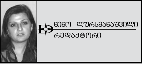
ნინო ლუსანაშვილი რედაქტორი

„მე არ ვიცი სხვა ადამიანი, რომელსაც ამ სტრუქტურაში უფრო მეტი დრო დაეხარჯა, მეტი ემოგზაურა, უფრო მეტი ხალხს შეხვედროდა საერთაშორისო დონეზე... გლობალურ საკითხებზე მუშაობას მან მთელი ცხოვრება შეაღია“, — ასე ახასიათებენ ყოფილ სენატორ ჯონ კერის კოლეგები. დრო აჩვენებს, როგორი