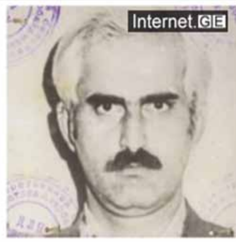
მერაბ კოსტავა MERAB KOSTAVA