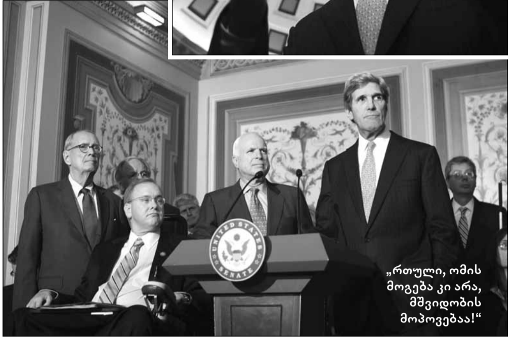
„რთული, ომის მოგება კი არა, მშვიდობის მოპოვებაა!“

ამბობს, რომ ღრმა ბავშვობიდან ერთი საზარელი კადრი ახსენდება: აქვითინებულ დედას ხელი აქვს ჩაჭიდებული და შენობის ნანგრევებში დაატარებს. ეს საფრანგეთში, სენ-ბრიაში ვიზიტია, სენ-ბრიას ნაცისტებისგან გათავისუფლების შემდეგ. საგვარეულო კარ-მიდამო და ბავშვობის აფეთქებული სახლი, რომელსაც გერმანელები ომის დროს შტაბად იყენებდნენ, დედამ სამიოდე წლის შვილთან ერთად მოინახულა. მოგვიანებით, ეს სახლი