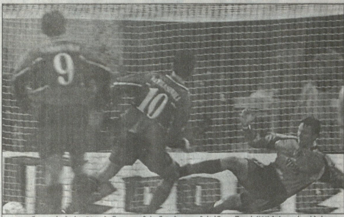
კილიანი — ფრანკ-ბურკი, კილიანი — მარცხენა, ბაიერი — მარცხენა, იმპერატორი (N9) ჩარევა არ დასჭირდა