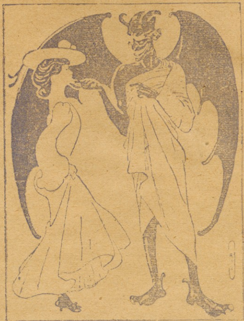
ეშმაკი. როგორ ბძანდება, ჩემო ძვირფასო. ქალი. თქვენ სცდებით მე სრულუბიათაც არ გღარვარ ძვირად.