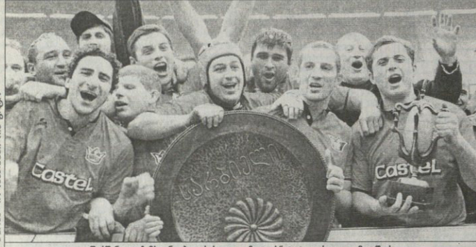
პარმანდ ჩემპიონ თბილისის „ლოკომოტივს“ ტიტულის დაცვა მოუწევს