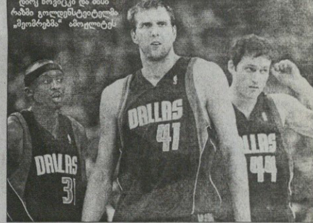
დრე ნოვიცი და მისი რამბი ვოლდესტეტიტელბი „ავიამშენის“ ანოვლტეს

„ეჟლენდ სტივტი“ მვერე წრე-ში 1991 წლის შემდეგ პირველად ვაგვიდა და იქ ოტტასა და „პო-სტონს“ შორის მუვიანბი შეხვედრა ამ ორთა შორის დევიც კი კვლე-ვიტე ვრავლებს და ავერ, მოწინააღ-მდეგბეტი მვერედ შეხვედრას ისე მაღაფერ, რომ არ ფიკე ერთი თამაში, ასე ვიქვიათ, არ ვაუტხემათ — ექ-ვისევიდ მასანბნებას მოვიდა სერიის ვალაწევიტე მატქს 5 მათს პოუ-სტონი მასანბნობს. კომე პირსტონი